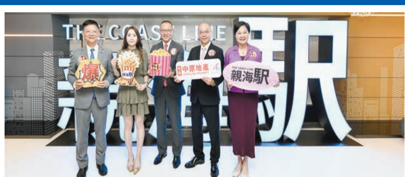
長實集團發展的油塘親海駅II以震撼價推售，旋即掀起入票潮。截至昨日下午約4時半，該盤收票量已錄得逾3.06萬票。