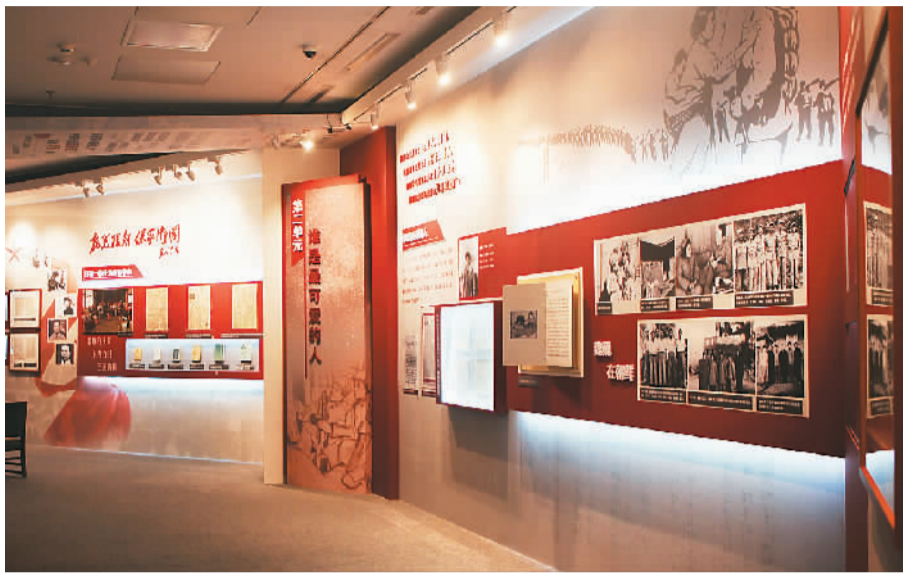
“坐标——中国现代文学馆藏革命文物特展”展厅一角。

稿、沈从文随笔《跑龙套》手稿、老舍长篇小说《四世同堂》手稿、罗广斌和杨益言的长篇小说《红岩》手稿、曲波长篇小说《林海雪原》残余手稿等众多珍贵藏品。中国现代文学馆还于今年收藏了台湾作家陈映真、绿蒂、张晓风、上官鼎的手稿、藏书、笔记等资料。