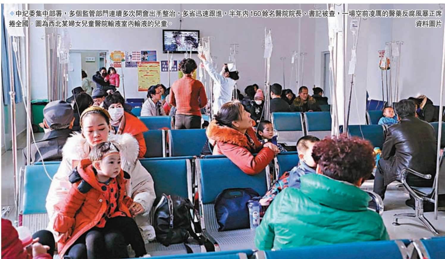
◆中紀委集中部署，多個監管部門連續多次開會出手整治，多省迅速跟進，半年內160餘名醫院院長、書記被查，一場空前凌厲的醫藥反腐風暴正席卷全國。圖為西北某婦女兒童醫院輸液室內輸液的兒童。

同時，8月以來，一周的時間，至少有10個學術會議宣布延期，涉及多省市醫學會，也包括中華醫學會。業內人士分析，在近期醫藥反腐的緊張氣氛下，部分會議的延期不排除是為了「避風頭」，尤其是背後有藥企支持的學術會議。此外，藥企也開始採取應對舉措，近日某藥企針對醫藥代表拜訪在工作群發布提醒，提出「代表不允許去醫院，所有的拜訪改成院外拜訪……並確保合規拜訪」。