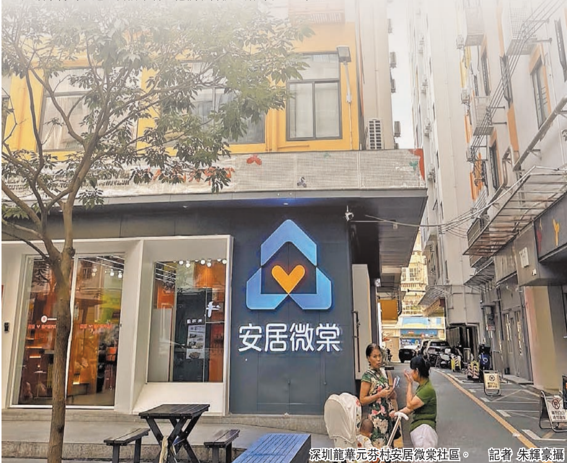
深圳龍華元芬村安居微棠社區。