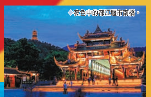
◆夜色中的都江堰南橋。