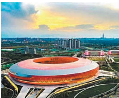
◆黃昏下的成都東安湖大運會場館