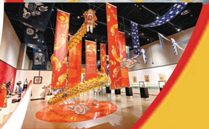
◆成都大運村內展覽