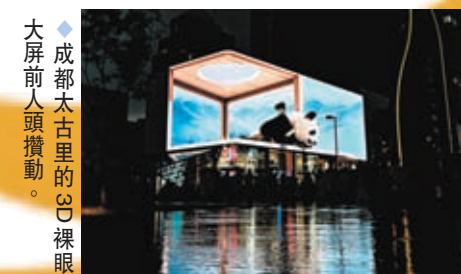
◆成都太古里的「裸眼」大屏前頭攔動。