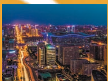
◆夜幕下的成都市合江亭。