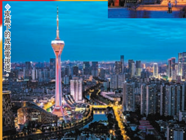
◆夜幕下的成都電視塔。