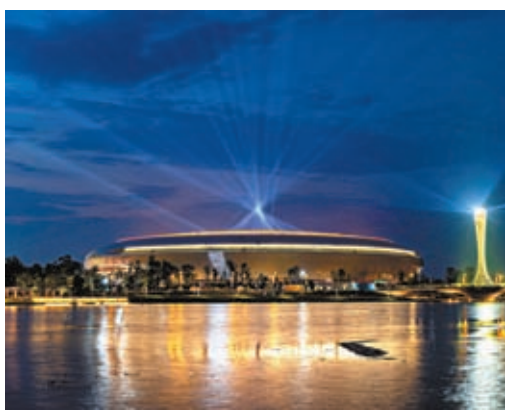
◆夜幕下的東安湖體育公園主體育場