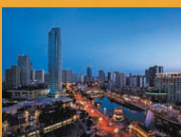
◆俯瞰夜色下的天府大道。