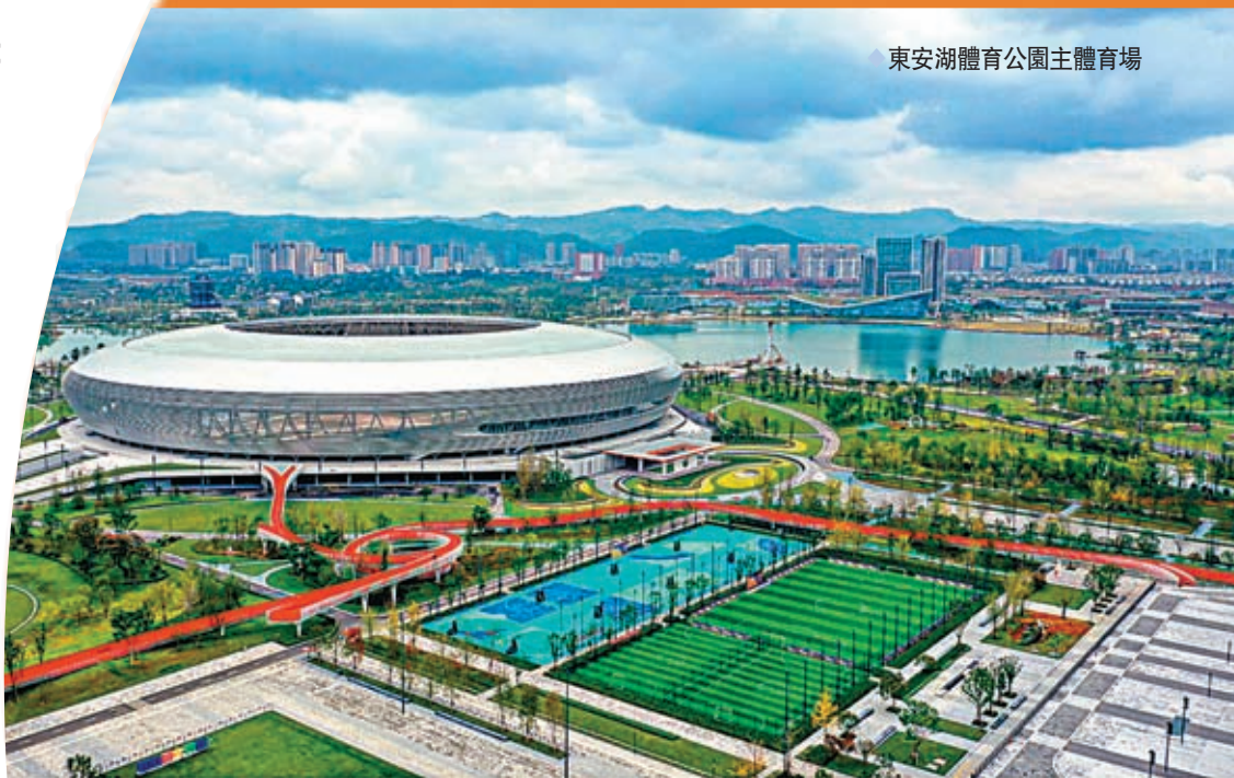
東安湖體育公園主體育場