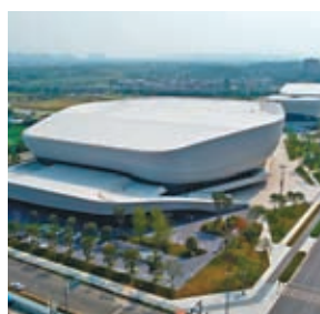
◆高新體育中心體育館

至2022年底，成都擁有體育場地設施6.41萬個，已建成5,000多公里長的天府綠道，植入體育設施1,700多處，全年舉辦全民健身活動6,000餘場次。當中，如成都東安湖大運會場館、鳳凰山體育公園、香城體育中心、高新體育中心體育館等。兩輛新一代「智軌列車」在四川成都快速公交K7線載客試運行，起訖點為五桂橋往返東安湖站。「智軌列車」為廣大民眾提供「綠色、低碳、環保」出行同時，也方便民眾前往東安湖體育公園場館觀看賽事，助力成都大運會。智軌就是智慧軌道快運系統，通過中央控制單元指令，精準控制列車在既定虛擬軌跡行駛，最高時速可達70公里，無需鋪設有形軌道，可在城市道路上靈活行駛。