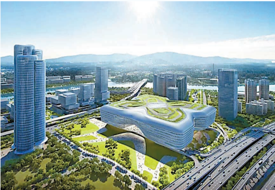
兩地創科「一區兩園」的核心，要依託新的皇崗口岸實現發展目標。圖為新皇崗口岸效果圖。

另外，王剛在接受內地傳媒訪問時表示，兩地創科「一區兩園」的核心，要依託新的皇崗口岸實現發展目標。皇崗口岸新聯檢大樓建成後，實行「一地兩檢」就可取消香港落馬洲管制站，按照香港的規劃，要在原來管制站區域建設科技園區。意味一個口岸的改造，可以為河套深港科技創新園區以及香港新田科技園騰出更多土地，釋放更多空間。