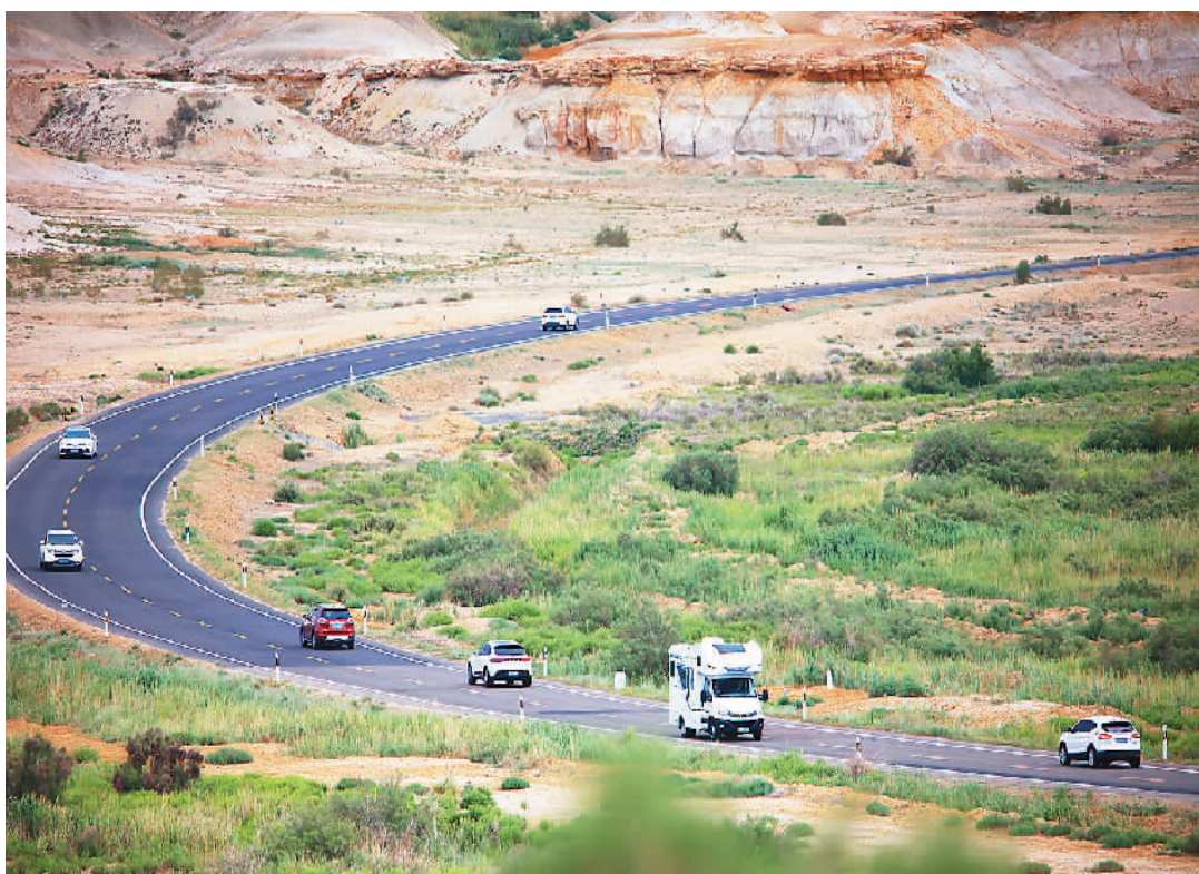
自驾游车辆行驶在新疆维吾尔自治区阿勒泰地区福海县环湖观光路上。

多家在线旅游平台的统计显示，今年暑假，成都、乌鲁木齐、三亚、海口、昆明、大理、贵阳、西安、西