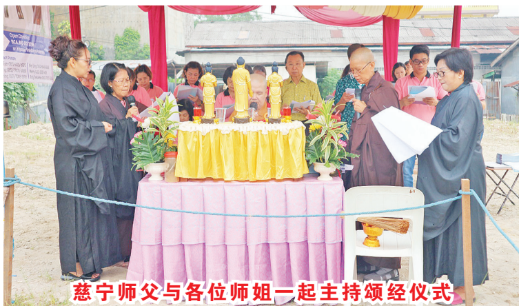
慈宁师父与各位师姐一起主持诵经仪式