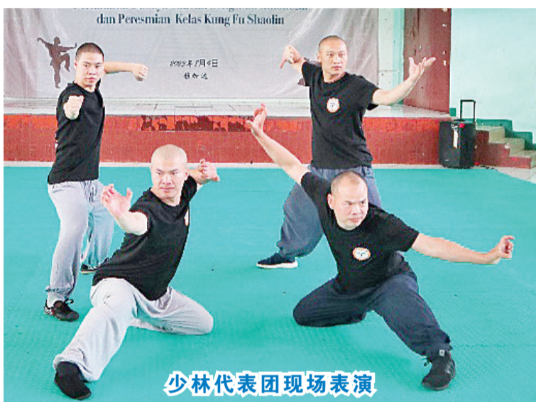
少林代表团现场表演