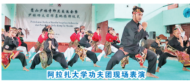
阿拉扎大学功夫团现场表演

功夫属于中国文化的一部分,提到功夫时很多人都会想到中国少林;穆尼先生还表示,阿拉扎大学功夫团就是他亲自创建并一直坚持下来的,希望未来有机会与印尼少林修文化中心进一步合作。释延恂法师表示,少林功夫作为中华民族传统文化的一部分,在2006年被评为国家级非物质文化遗产,多年的发展中,这一文化遗产得到了世界人民的关注与认可,越来越多的人练习少林功夫,从而喜爱少林文化。此次出行印尼交流得到少林寺方丈大和尚的支持,希望通过少林功夫的传