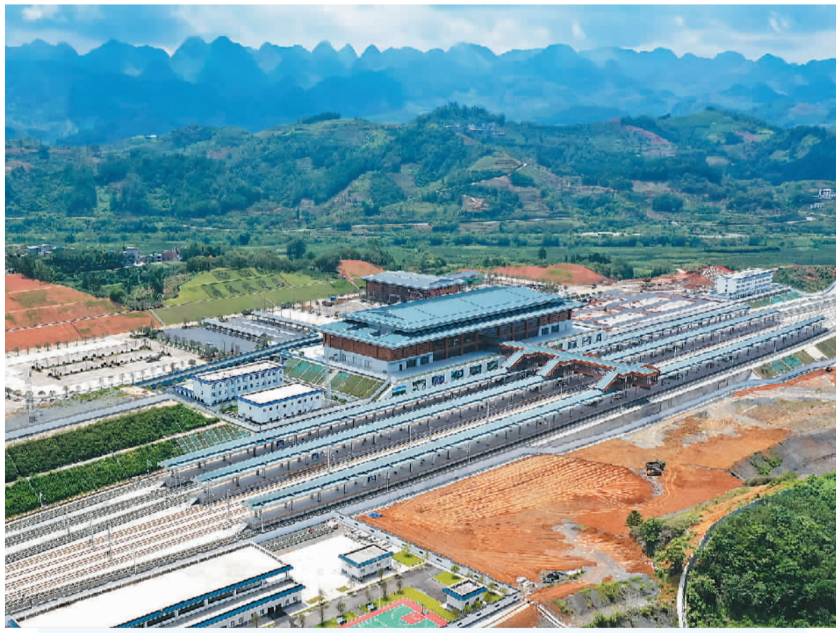
近日,贵南高铁荔波站站房整体建设完成。贵南高铁是我国“八纵八横”高速铁路网中内蒙古包头到海南海口通道的重要组成部分,也是黔桂地区首条设计时速350公里的高速铁路。贵南高铁开通后,从贵阳至南宁铁路运行时间将从现在的5个多小时缩短至2个小时左右。图为建设完成的荔波站站房及站台。

2023世界机器人大会由北京市人民政府、工业和信息化部、中国科学技术协会共同主办,将于8月16日至22日在北京举行,大会主题为“开放创新 聚享未来”。