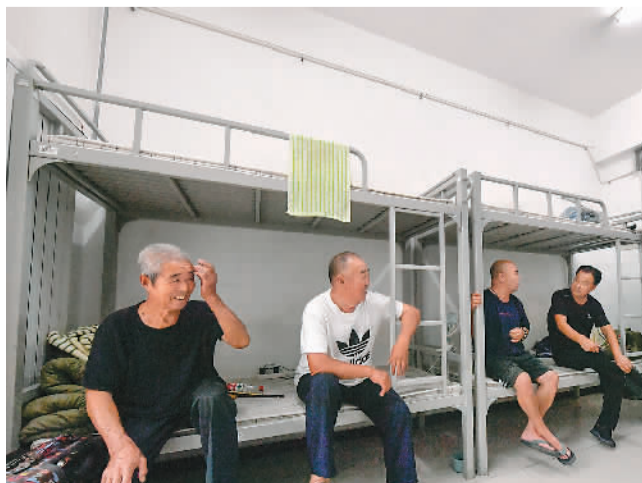
图为八月一日，在天津市武清区职业教育中心临时安置点，转移群众在房间内交谈。