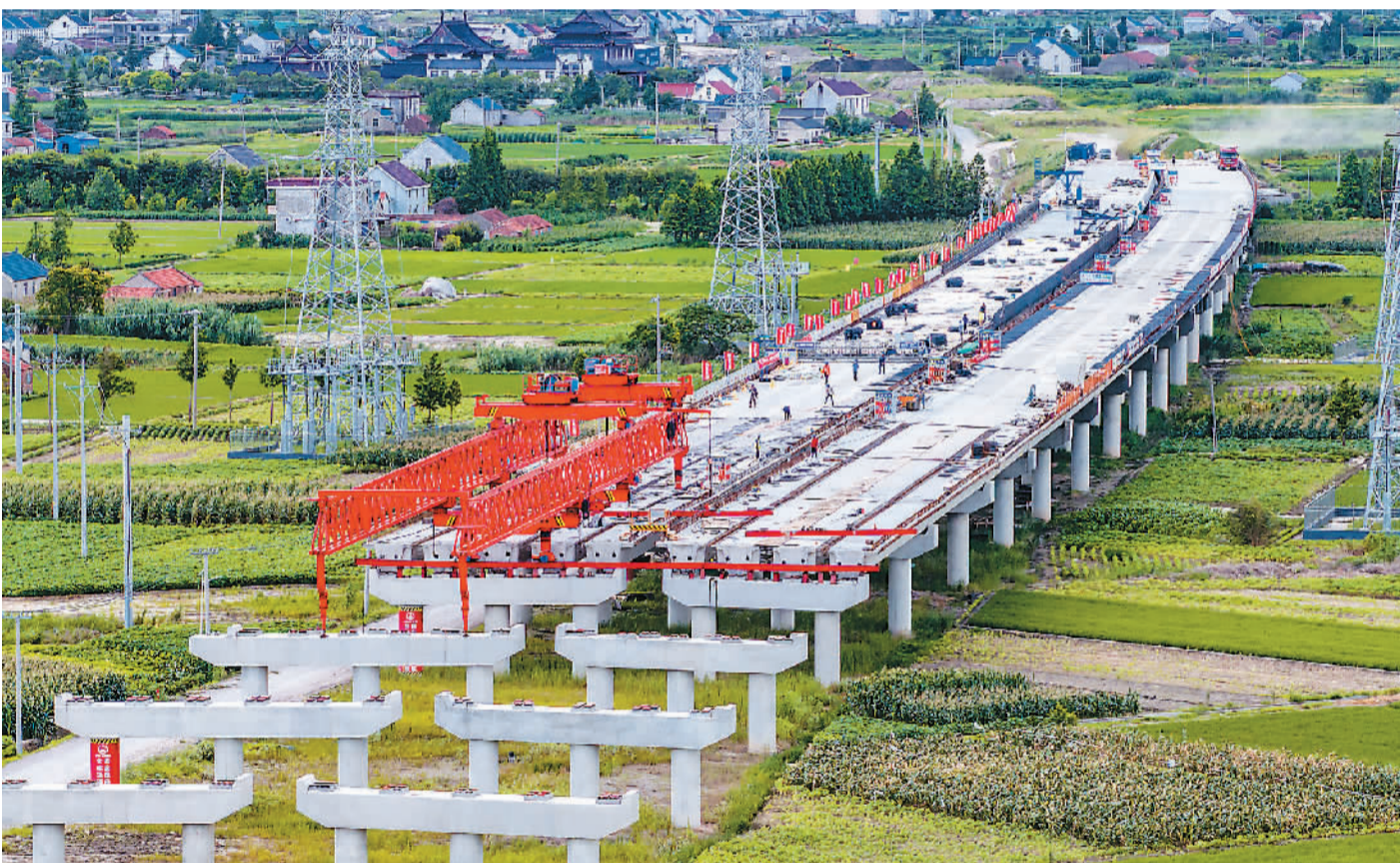
江苏南通洋通高速洋如段正在紧锣密鼓地建设中，建成后南通市区可高速直达洋口港，对完善区域高速公路网，促进沿线经济社会发展具有重要意义。

监测显示，2011—2020年，长江口海域共鉴定出大型底栖动物284种，其中多毛类128种，甲壳类64种，软体动物56种，棘皮动物16种，其他类合计20种。