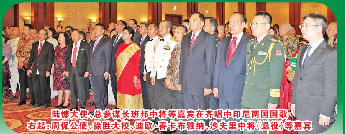
陆慷大使、总参谋长班邦中将等嘉宾在齐唱中印尼两国国歌。右起：周佩公使、徐胜大校、迪欧、善卡布雅纳、沙夫里中将(退役)等嘉宾

【本报讯】7月31日晚，中国驻印度尼西亚使馆在雅加达举行盛大招待会，隆重庆祝中国人民解放军建军96周年。中国驻印尼大使陆慷等使馆以及中国驻东盟使团有关领导和外交官出席。印尼国民军总参谋长班邦中将、陆军参谋长特别助理纽曼中将、原海军参谋长马塞提奥退役海军上将、原国防部副部长沙夫里退役中将、原国防大学校长玛希德退役海军中将等印尼军政高官，各国驻印尼武官，印尼工商界代表，驻印尼中资机构代表，华人华侨代表约700人参加盛会，共襄盛举。