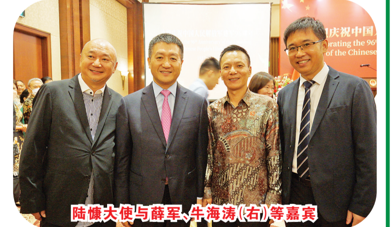
陆慷大使与薛军、牛海涛(右)等嘉宾