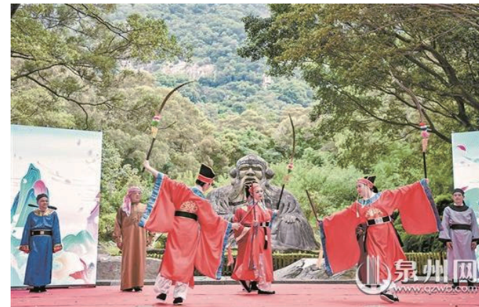
清源山老君岩前舉行宋元祈風祈福儀式

泉州網訊（記者林福龍 文/圖）“共慶三山世遺，品味宋元清源”，7月25日，清源山風景區慶祝泉州申遺成功兩周年活動在清源山、九日山、靈山聖墓三個世遺點同時舉行，整個活動將持續到本月29日。