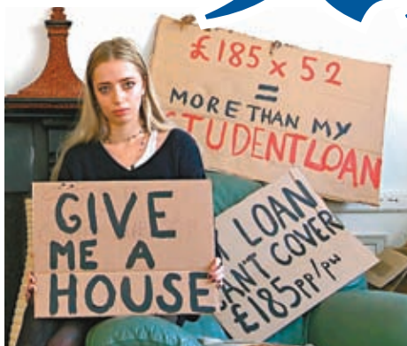
住宅租金高昂，有學生抗議表示難以負擔。

英國高等教育統計局數據顯示，英國大學生人數目前創下歷史新高，尤其近年以來，當地更多高中畢業生升讀大學，許多學府也積極招募留學生。各大城市對學生宿位的需求增進，遠超興建宿舍或學生公寓的速度，單是在學府林立的倫敦，當地新學年學生宿位缺口預計就會達到10萬個，相當於預期需求的一半，較2017到2018學年增幅達45%。