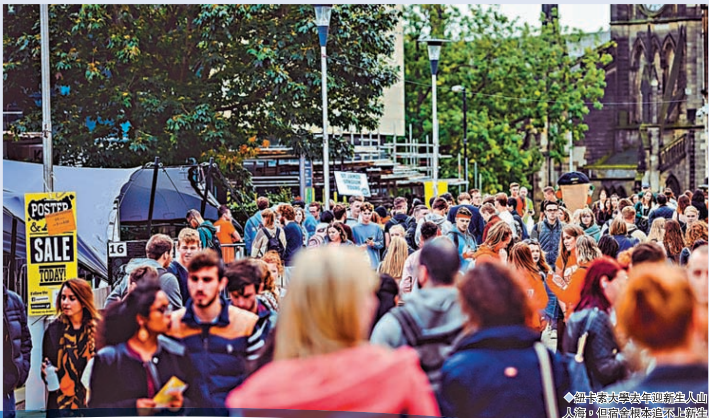
紐卡素大學去年迎新生人山人海，但宿舍根本追不上新生人數。網上圖片

香港文匯報訊 英國各大城市住宿難，或會成為留學生赴英的新輪「攔路虎」。《金融時報》上周五引述房地產顧問公司CBRE統計顯示，英國30座最大的城市新學年需要合共35萬個學生宿位，才能滿足預期住宿需求。按當地下學年預計100萬名大學生需要宿位計算，35萬個學生宿位缺口，就等於有多達三分之一的學生恐無片瓦遮頭。報告提醒學生宿位短缺，加上通脹導致日常開銷攀升，勢必衝擊英國對留學生的吸引力。