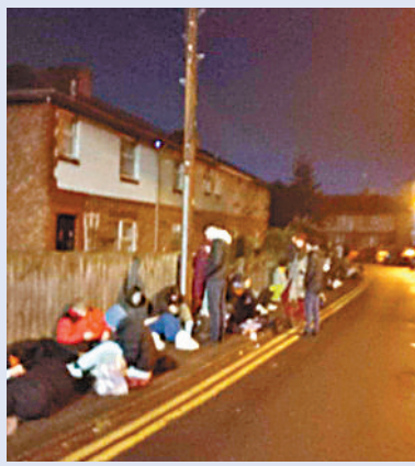
杜倫大學學生早前連夜排隊，為確保新學年住宿。網上圖片