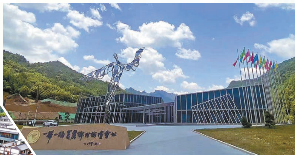
美麗鄉村論壇會址。