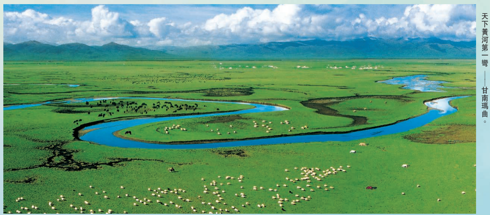
天下黃河第一彎——甘南瑪曲。

當前，甘肅省村莊環境基本實現乾淨整潔有序，農民群眾環境衛生觀念發生可喜變化，農民的收穫感和幸福感不斷提升，全省形成營造共同建設宜居宜業和美鄉村的濃厚氛圍。