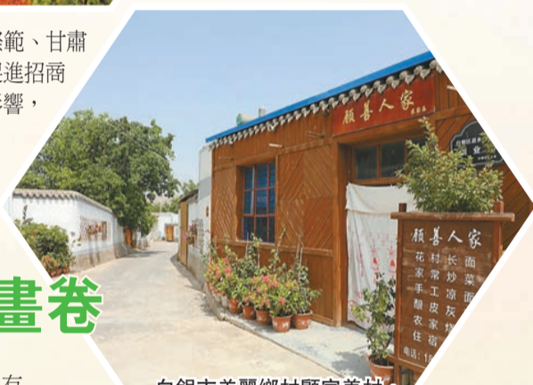
白銀市美麗鄉村顧家善村。