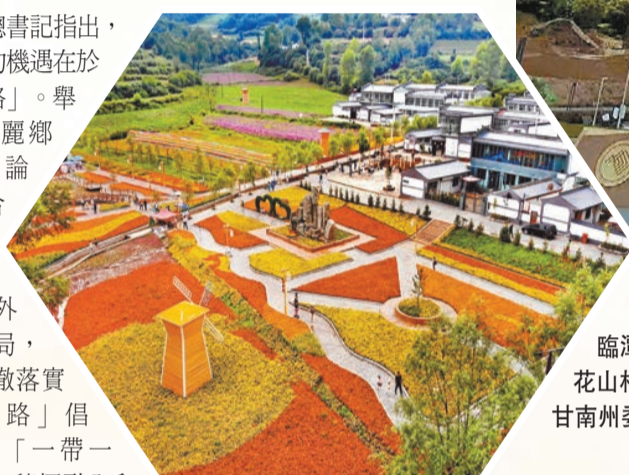
臨潭縣八角鄉廟花山村。

「曾經普通普通的村子，經過人居环境整治，如今已面貌一新；曾經的土坡土坑，經過美麗鄉村建設，如今已蝶變重生；曾經不起眼的農家小院，經過鄉村旅遊的發展，如今已成爲開門迎客的農家樂……」白銀區花村顧家善、石村董帽塔、鄉坊強灣村、桃園羅家灣、古鎮大川渡、大坪農樂園「六朵金花」的嬗變，就是白銀市扎