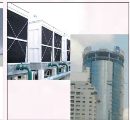
Terminal 3 Soekarno Hatta project

SPX SPX MARLEY COOLING TECHNOLOGIES (USA)