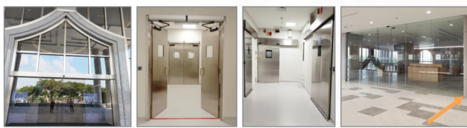
Tzu Chi Hospital

ASSA ABLOY Automatic Door Operator (Sweden)