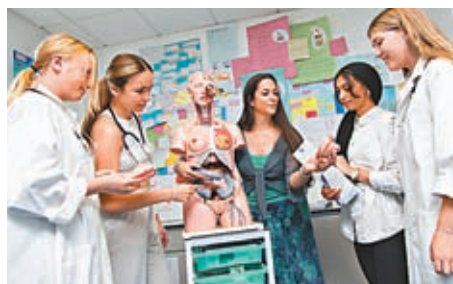
T-Level涵蓋會計、金融、醫療保健和製造業等科目。

分析也指出，涵蓋英國24間最知名學府的羅素集團中，還有一半的大學現時不接受T-Level成績，所以多數英國學生仍傾向選擇A-Level課程。不過也有學生認為相較以前的職業教育課程，T-Level不再視考試成績為唯一評估標準，會提高他們選擇職業教育的興趣。