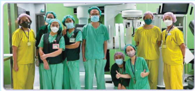
林口长庚胸腔外科特色治疗项目: 达文西及微创手术 (含肿瘤切除)、漏斗胸矫正手术、肺肿瘤中定位等

微创手术在胸腔外科领域已盛行十余年, 相比常见的胸腔镜手术, 达文西机械手臂辅助手术是近十年新兴的一种微创技术, 可视为胸腔镜的进化版, 除了可3D放大10-15倍让手术医师更清晰地看见患者组织的细部结构外, 达文西机械手臂手术系统最大优势在于手术中器械操作精细度的提升。