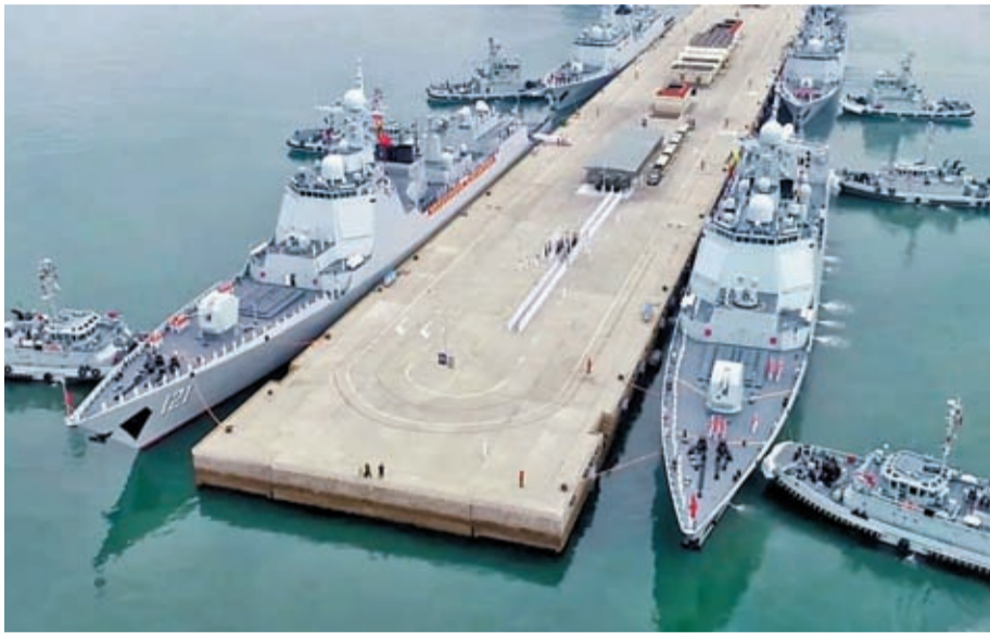
7月15日上午，參加「北部·聯合—2023」演習的中方海上編隊從山東青島某軍港解纜起航，前往預定演習海域。

香港文匯報訊（記者 葛沖 北京報道）中國國防部15日宣布，根據中俄兩軍年度合作計劃，俄羅斯軍隊將於近日派出海空力量參加中國人民解放軍北部戰區在日本海中部組織的「北部·聯合—2023」演習。中國國防部發布的消息稱，此次演習課題為「維護海上戰略通道安全」，旨在提升中俄兩軍戰略協作水平，增強共同維護地區和平穩定、應對各種安全挑戰的能力。專家認為，此次演習針對的是美日韓三國不斷在中俄周邊加強軍事同盟，威脅中俄海上戰略通道安全，演習具有很強實戰性。