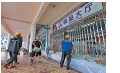
7月16日，工人將防沙袋擺放在海口秀英港的候船大廳入口。受颱風「泰利」影響，瓊州海峽客滾輪當日6時起全線停運。

儘管當局否認美國施壓台灣研發生物戰劑，但軍方投入研發病毒，開發生物戰劑，其實有跡可循。2021年10月，防務部門宣布將建立新的P4實驗室，當局說法是，現有P4實驗室約在30年前建設，已不符合現行法規。因此規劃建置新型P4實驗室，希望能符合國際上最嚴格的標準，成為亞太地區對抗新興及再現傳染病的領先設施。台媒稱，相關說辭，是軍方以防疫為藉口，遮蓋了研發生物戰劑的秘密。而且這個新建實驗室，其實