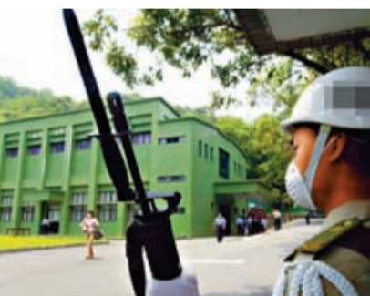
台防務部門下屬機構預防醫學研究所，擁有台灣地區唯一的P4等級實驗室。

是美國要台灣花錢蓋的。有分析指出，美國要求台灣利用病毒研發生物戰劑，針對的目標是誰，在近年民進黨鼓吹「反中」「仇中」的氛圍下，答案已是不證自明。現在中國的民進黨盲目親美，不考慮人道，不在乎風險，一切以美國利益為首是瞻，犧牲兩岸人民利益，在所不惜，毀棄了該有的良知。