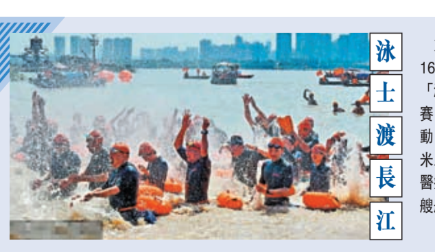
第48屆武漢「7·16渡江節」16日鳴槍開賽，兩千餘名中外「泳士」參與個人搶渡長江挑戰賽，以及群眾方隊橫渡長江活動。

規章的適航要求。根據東航的規劃，第二架C919將與首架機「搭檔」，首先投入東航「上海虹橋—成都天府」空中快線，後續將逐步拓展更多航線。作為國產C919大型客機的首發用戶，東航於去年12月9日正式接收C919的全球首架交付機；今年5月28日，東航圓滿完成C919首個商業航班「上海虹橋—北京首都」的往返飛行，此後這架C919在滬蓉快線上服務旅客。截至7月12日，首架C919共執行87班次商業航班，其中京滬航班2班、滬蓉航班85班，平均客座率近80%，累計服務旅客11,095人次，累計商業運行250.10小時。