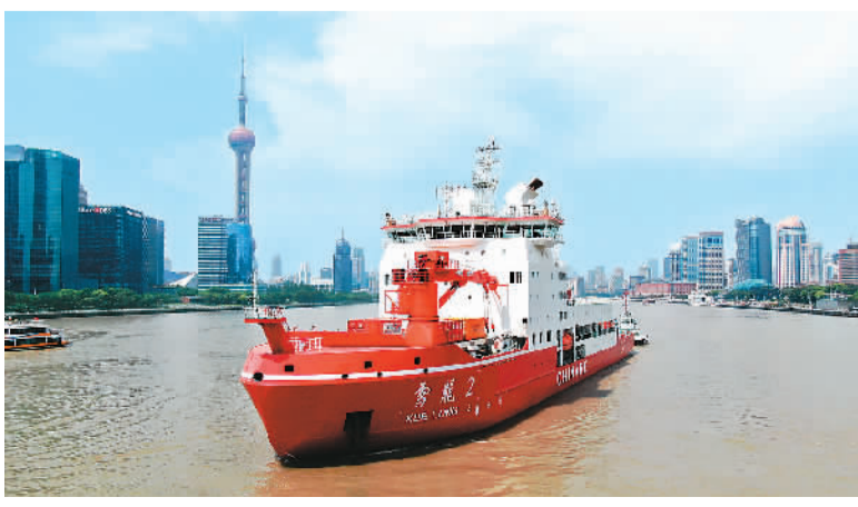
7月12日，由自然资源部组织的中国第13次北冰洋科学考察队，乘坐“雪龙2”号极地科考破冰船，从上海港奔赴北冰洋执行科学考察任务。图为“雪龙2”号航行在黄浦江上。