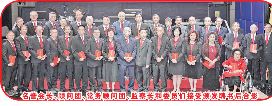
名誉会长、顾问团、常务顾问团、监察长和委员们接受颁发聘书后合影