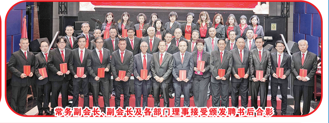
常务副会长、副会长及各部门理事接受颁发聘书后合影