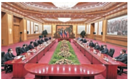
◆7月10日下午，中國國家主席習近平在北京人民大會堂會見俄羅斯聯邦委員會主席馬特維延科。

習近平指出，在雙方共同努力下，中俄關係始終保持健康穩定發展勢頭，各領域合作穩步推進，兩國世代友好的社會基礎和民意基礎更加牢固。今年3月，我對俄羅斯進行國事訪問，同普京總統就深化兩國全面戰略協作和各