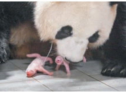
▲這是7月7日在位於韓國京畿道龍仁市的愛寶樂園裏拍攝的大熊貓媽媽「愛寶（華妮）」和剛誕生的大熊貓寶寶。