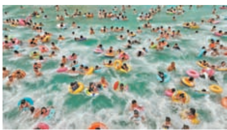
◆中國多地持續高溫，遊客在四川省遂寧市一旅遊度假區戲水消暑。

中國駐韓國大使館表示，感謝韓國民眾對旅韓大熊貓一家的呵護與喜愛，衷心祝願新誕生的兩隻熊貓寶寶健康成長，早日同公眾見面，為大家帶來更多歡樂，為增進中韓友誼繼續注入新的正能量。