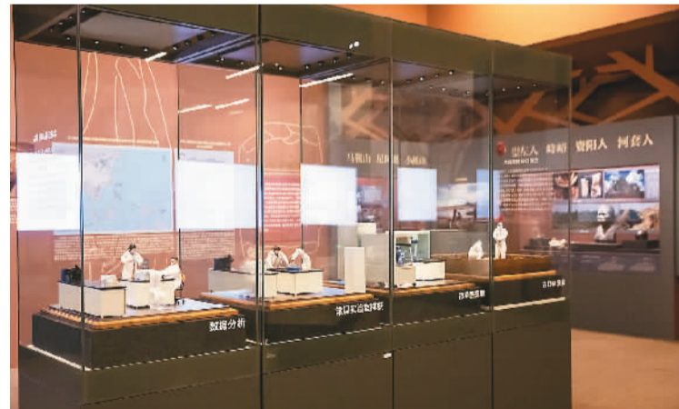
展览中展示的科研场景模型。

20世纪80年代以来，古DNA成为研究人类遗传与演化史的有力工具。展厅里有一组栩栩如生的微缩模型，让观众直观地了解研究人员如何从古生物样本中提取古DNA进行分析研究。