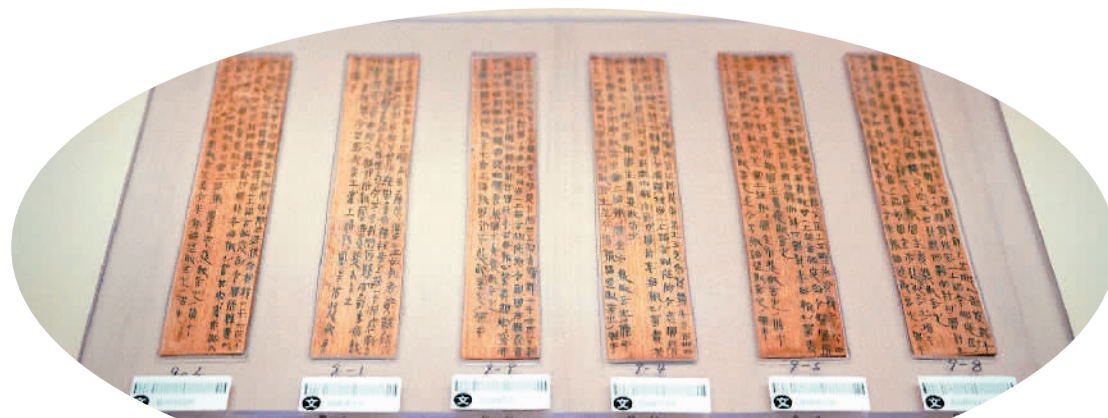
湖南省龙山县里耶古城遗址出土的秦代简牍，湖南省文物考古研究所藏。

中华文脉绵延不绝，历久弥新。在祖国日益强盛、中外交流蓬勃发展的今天，汉字在更广阔的世界舞台上持续焕发灿烂光彩。