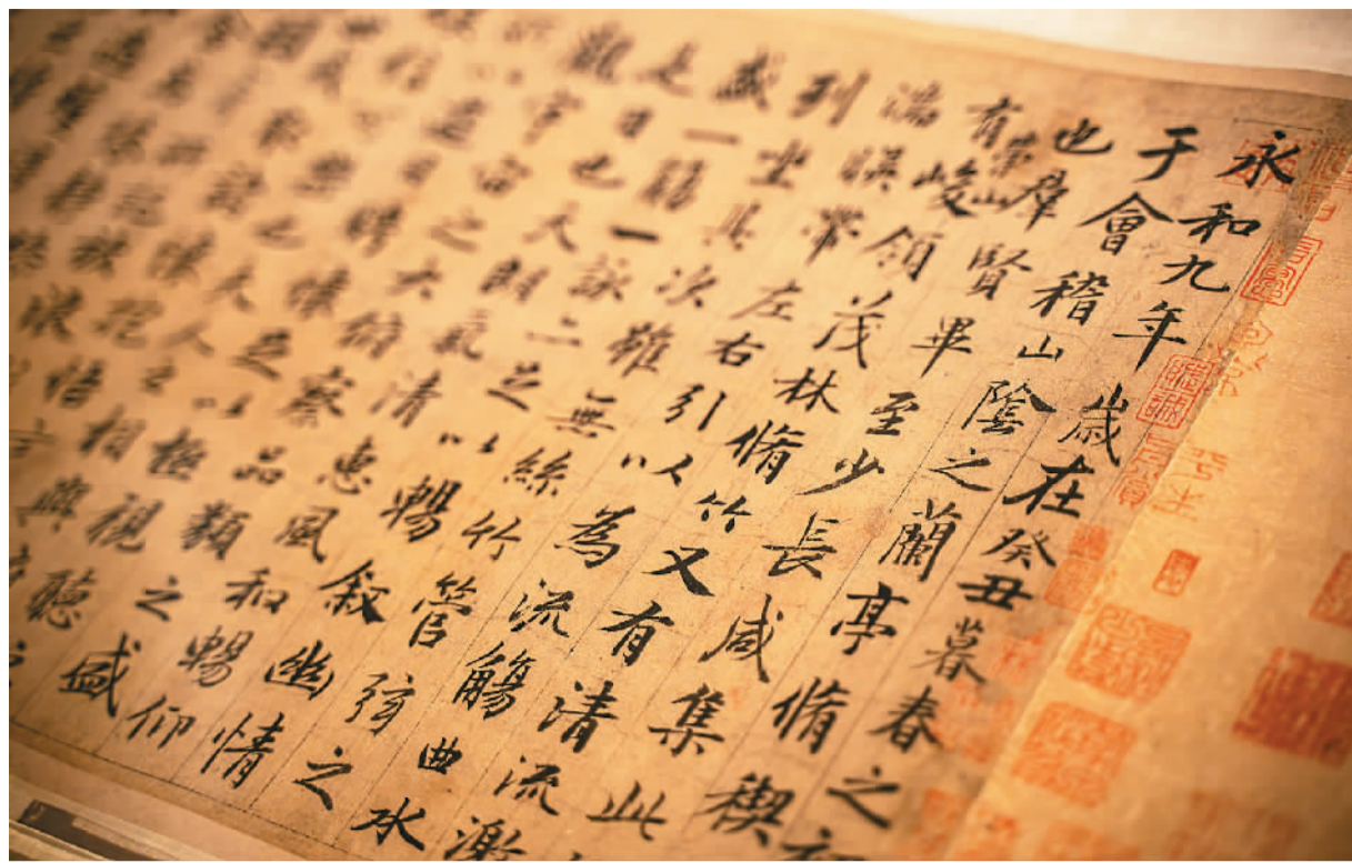
元代赵孟頫《兰亭序》，无锡博物院藏。