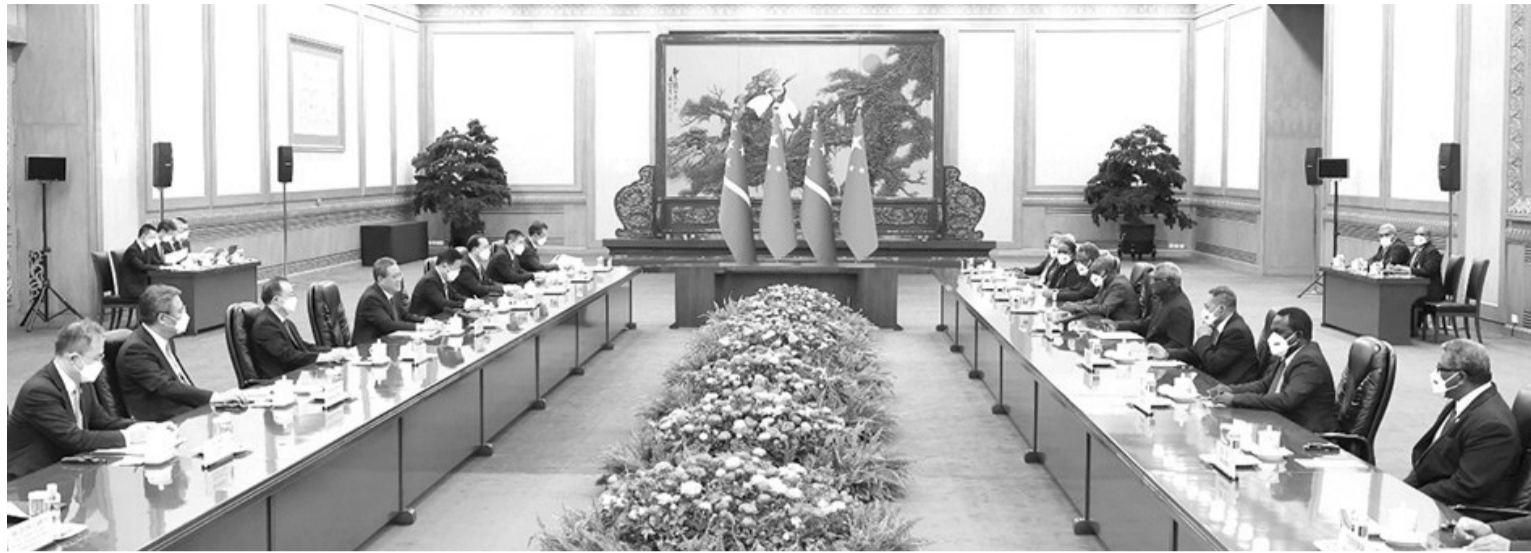
7月10日上午,中国国务院总理李强在北京人民大会堂同来华进行正式访问的所罗门群岛总理索加瓦雷会谈。