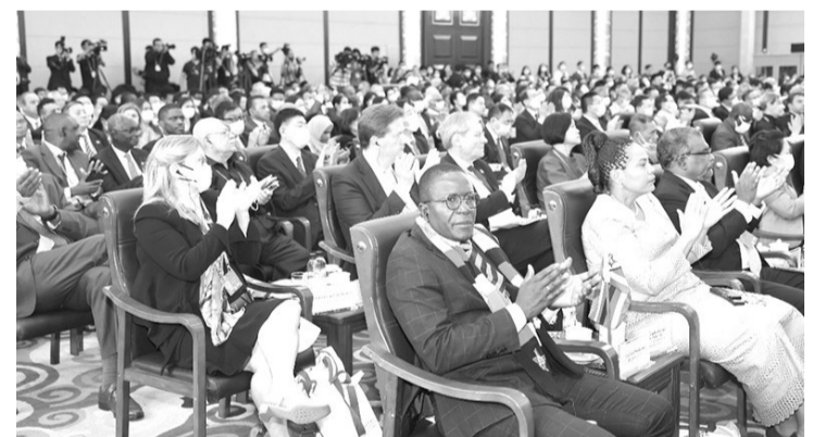
全球共享发展行动论坛 首届高级别会议在京举行 7月10日,全球共享发展行动论坛首届高级别会议在北京举行。

中新网7月11日电据台湾“中央社”报道,台当局今日(11日)通过马英九基金会邀请陆生来台交流专案。 11日,台“移民署”会同相关机关共同审查“财团法人马英九文教基金会邀请大陆学生访台案”,经过联合审查会决议,专案同意大陆师生来台参访。 相关人士11日表示,该案师生预计将于7月15日抵台,参访日期至23日,计划走访台湾大学、台湾政治大学等多个学校,师生以交流、参访为目的,预计将有来自大陆5校37人赴台。 相关人士还指出,联审会议同意该案原因为疫情后已经陆续开放大陆学生来台,交换学生、短期研修生来台,对于两岸师生健康有序交流、良性互动乐观其成。