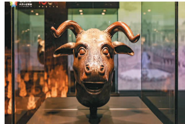
圆明园海晏堂十二生肖之牛首原物。

本报电（记者赵珊）近日，中国旅游集团（香港中旅集团）联合中国保利集团、香港城市大学，在香港举办“盛世首玺 天玺芳华——庆祝香港回归祖国26周年暨中旅百年华诞圆明园国宝首物文物展”。