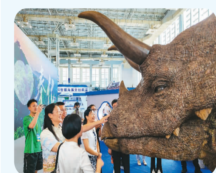
在2023海丝之路文化博览会上，游客们与“恐龙”零距离互动。