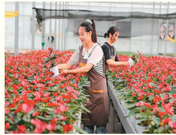
山东双福花卉有限公司技术员在管理花卉。

博览会期间，还举办了“中华文化与现代制造创新大会”“首届价值中国品牌文化圆桌对话”“盛世修典——‘中国历代绘画大系’成果展·宁波特展”“海丝文旅产业招商推介会”“宁波文博会奇妙夜”等多项具有特色的配套活动，进一步把海丝文化传递到市民身边，让本届博览会不仅是文旅展示、交流、交易的焦点，也成为全城联动、全民共享的“文化大餐”。