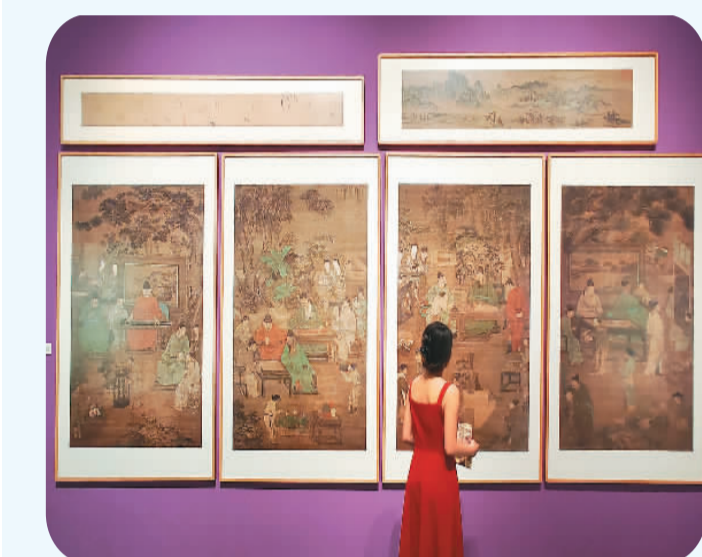
盛世修典——“中国历代绘画大系”成果展·宁波特展在浙江宁波美术馆开幕。图为市民在观展。