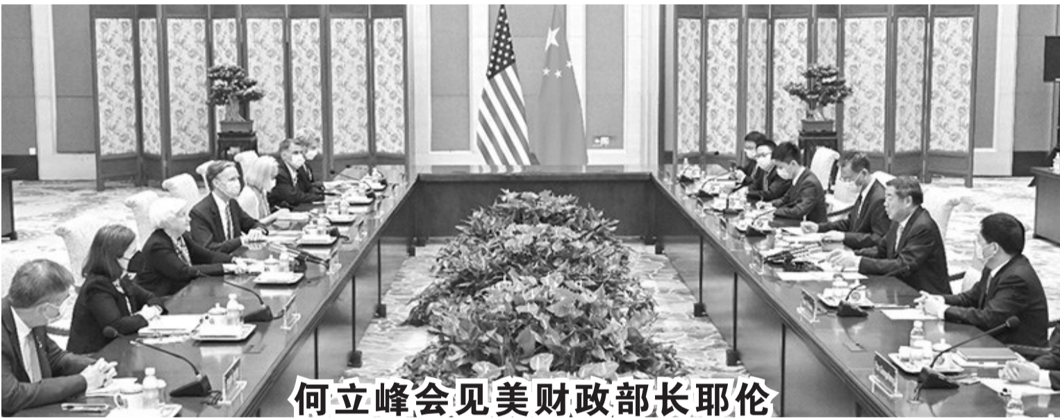
何立峰会见美财政部长耶伦

五是强化监督管理和法律责任。规定私募投资基金业务活动的监督管理应当贯彻党和国家路线方针政策、决策部署。明确国务院证券监督管理机构的监管职责及监管措施等。规定国务院证券监督管理机构会同国务院有关部门和省级人民政府建立私募投资基金监督管理信息共享、统计数据报送、风险处置协作机制。此外,对违反本条例的法律责任作了明确规定。