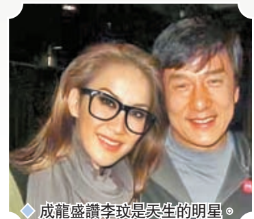
◆成龍盛讚李玟是天生的明星。