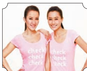
◆2014年，陳法拉曾與李玟出席關注乳癌活動。

大家關心 CoCo 身後事的進度及形式，有消息指 CoCo 的喪禮將以佛教儀式舉行，Coco 生前最愛唱歌，所以家人打算8月舉行一個追思會，讓歌迷好好送別偶像。香港文匯報向 CoCo 的好友核實後，好友指香港政府規定需經過解剖程序，解剖需時，故追思會未必趕得及8月舉行。