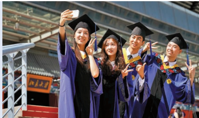
◆7月5日，畢業生在北京大學2023年研究生畢業典禮暨學位授予儀式結束後拍照留念。