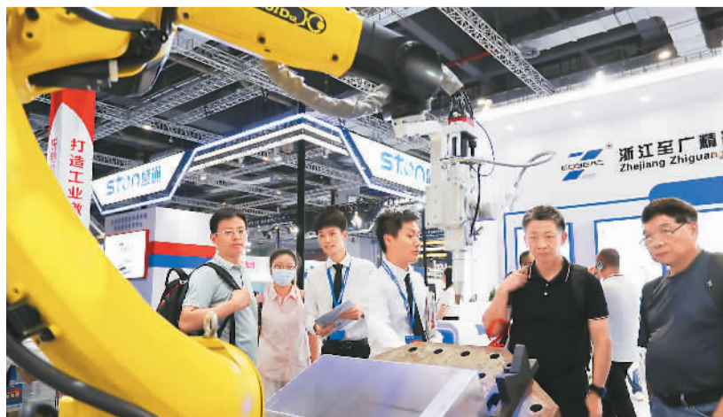
7月5日，在2023上海国际机床展上，参观者在一台进行作业演示的机器人激光焊机前驻足观看。