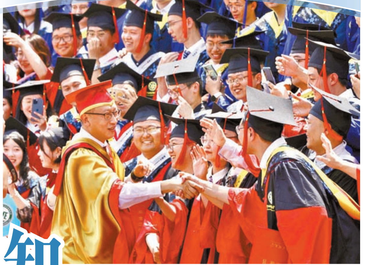
◆7月1日，中國科學院大學校長周琪院士與畢業生握手並合影留念。