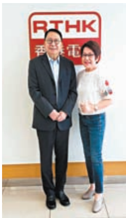
◆政務司司長陳國基非常關心老人家。

潤物細無聲，陳國基司長就像潤滑劑將各大部門協調起來，非常重要！正如司長所言，我們要懷着信心團結往前走，香港一定得，因為香港是我家！