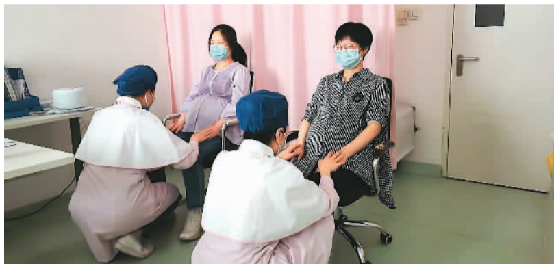
图为北京佑安医院产科，护士在为孕妇做产前的芳香呵护。

获得了广泛应用。明代医学巨著《本草纲目》明确记载了芳香疗法中的擦法、敷法、扑法等用药方法。清代中医典籍《理喻骈文》系统阐述了中医芳香疗法的作用机制、辨证论治、药物选择、用药选择、用药剂量及注意事项，使中医芳香疗法具备了完整的理论体系。