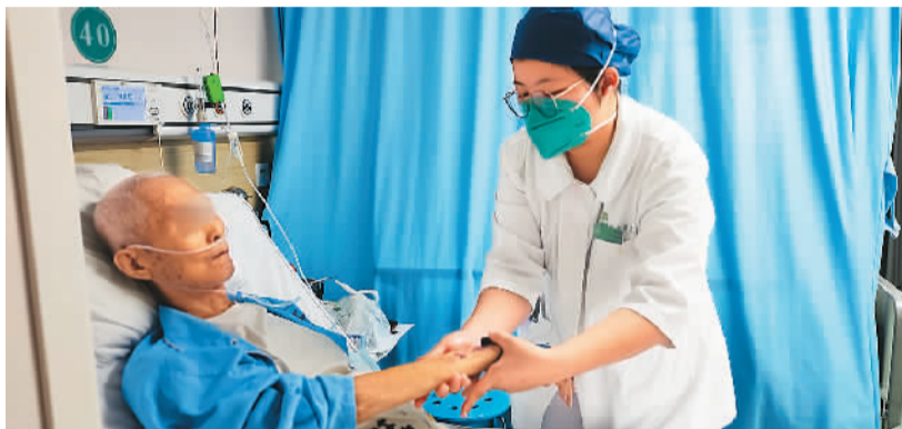
图为北京佑安医院肝病二科病房，护士在为患者做芳香治疗。

芳香疗法是以天然植物香料或芳香精油等为媒介，通过抚触、嗅、熏蒸、扩香等方式，经由呼吸、皮肤或血液循环进入体内，帮助协调机体