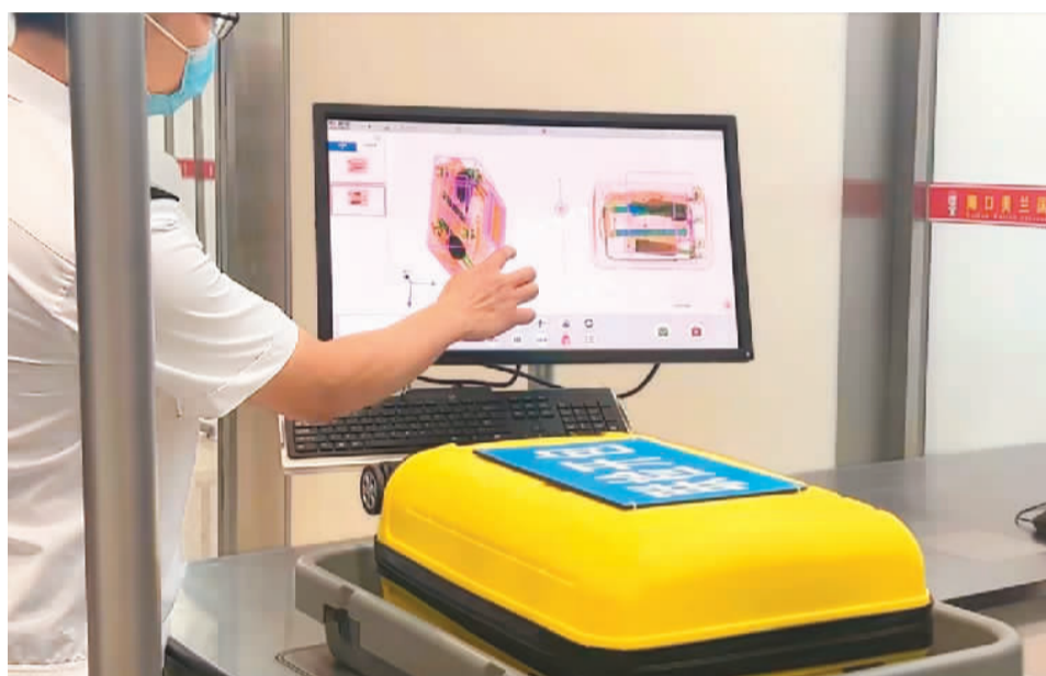
▲在海口美兰国际机场T2航站楼压力测试现场，工作人员展示行李查验系统。