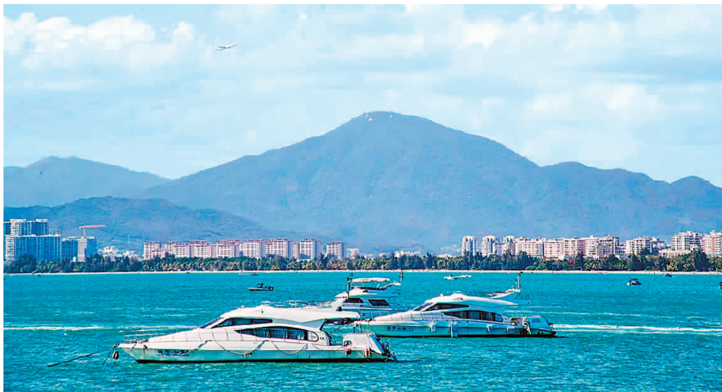
▲游艇产业是三亚的特色产业。图为行驶中的游艇。