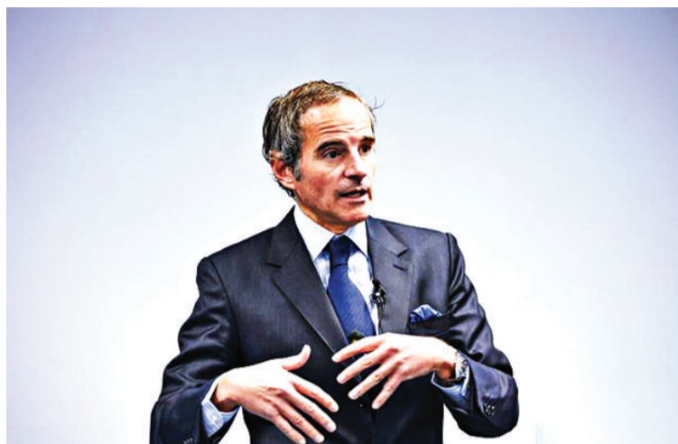
资料图:国际原子能机构总干事格罗西。

据报道,此前,IAEA调查团已对福岛核污染水排海问题进行了多次调查,并制作了关于核污染水入海安全性的调查报告。报道称,格罗西计划