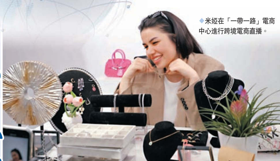
◆米妮在「一帶一路」電商中心進行跨境電商直播。