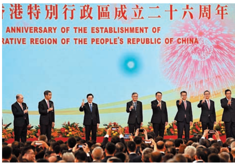
◆李家超和主禮嘉賓向現場祝酒。