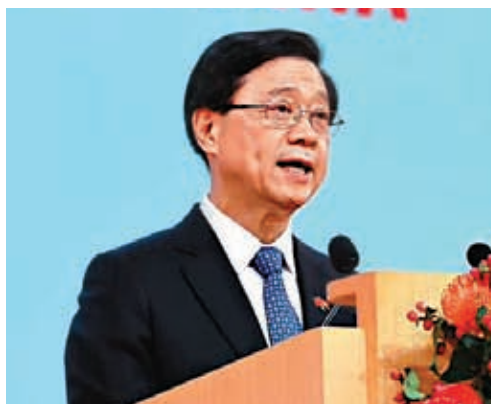
◆李家超表示，自己對香港充滿信心。