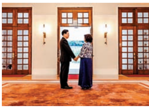
◆李家超和夫人出席慶祝回歸活動。