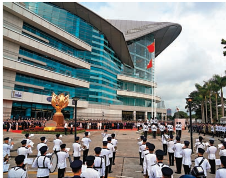
◆香港特區政府在灣仔金紫荊廣場舉行升旗儀式，慶祝香港回歸祖國26周年。