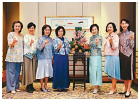
◆香港特首夫人和女官員身穿華服合照。