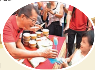
◆陳茂波向小朋友遞上小吃。

李家超引用《晏子春秋》中的「為者常成，行者常至」，即一個人只要努力去做事就會取得成功，一個人只要堅持不懈地朝着目標奮勇前進就可以到達目的地這典故，強調特區政府會繼續做實事，做成事，以行動爭取信任，以結果拉近距離，以成績凝聚互信，團結社會，共建香港。