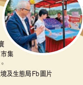
◆謝展寰出席周末市集開幕典禮。