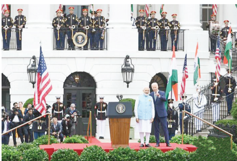
当地时间6月22日,美国总统拜登在白宫会晤来美进行国事访问的印度总理莫迪。图为双方出席欢迎仪式。

扬·埃里克松表示,这座有140年历史的游乐园将关闭至少一周,以协助警方调查。 据格勒纳伦德游乐园官网显示,钢制轨道的“喷气机”过山车最高时速可达90公里,轨道最高处距地面30米,年均运载游客超过100万人次。