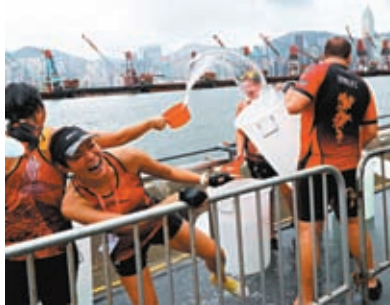
◆烈日當空，參賽選手不忘潑水玩樂。