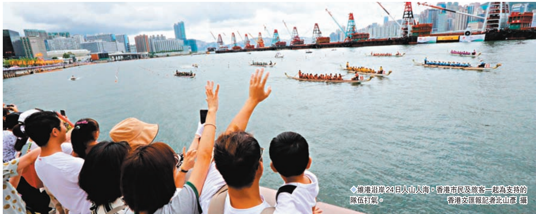
◆維港沿岸24日人山人海，香港市民及旅客一起為支持的隊伍打氣。

由香港旅發局及中國香港龍舟總會合辦的「香港國際龍舟邀請賽」一連兩日在尖東海濱及維港舉行，共設17項比賽，包括新設的「港澳盃」和「粵港澳大灣區錦標賽」。其中，5大賽事首設獎金，冠軍隊伍可獲1萬美元。