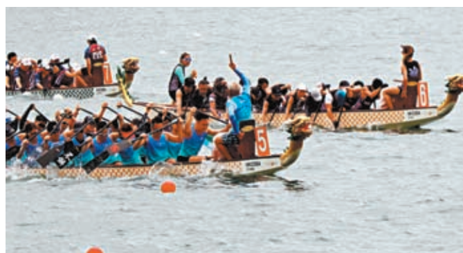
◆超過160支來自10個國家及地區的队伍參賽。