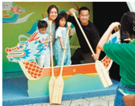
◆市民模仿划龍舟拍照留念。