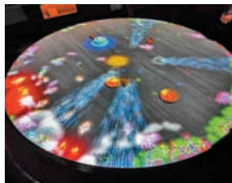
◆小人兒所居住的桌子可玩特別效果。