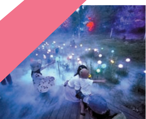
◆民眾在北京國際光影藝術季探秘「奇光」星球。