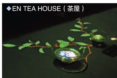
◆EN TEA HOUSE (茶屋)