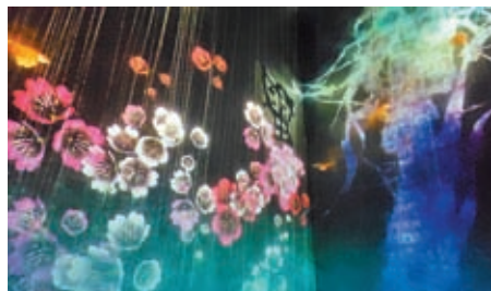
◆當你觸摸在牆壁上的哪隻字，那隻字就會出現相關的影像。

在眾多藝術作品當中，筆者極喜歡那幅滿布不同字的牆壁，如鳥、花、風、山等，當你觸摸哪隻字，那隻字就會出現相關的影像，如當你觸摸「鳥」字後，眾多雀鳥畫面出現；當你觸摸「花」字後，繁花出現，極為美麗。另外，在茶屋房間中，作品名為「綻放在茶碗裏那無限宇宙中的花朵」，倒完茶之後，茶中會不斷綻放花朵，當觀賞者拿取茶碗，花朵就會散落在花瓣則會延伸到茶碗之外，花朵在茶中不斷綻放。如此喝茶，就如同將無限擴張的世界喝下去似的。