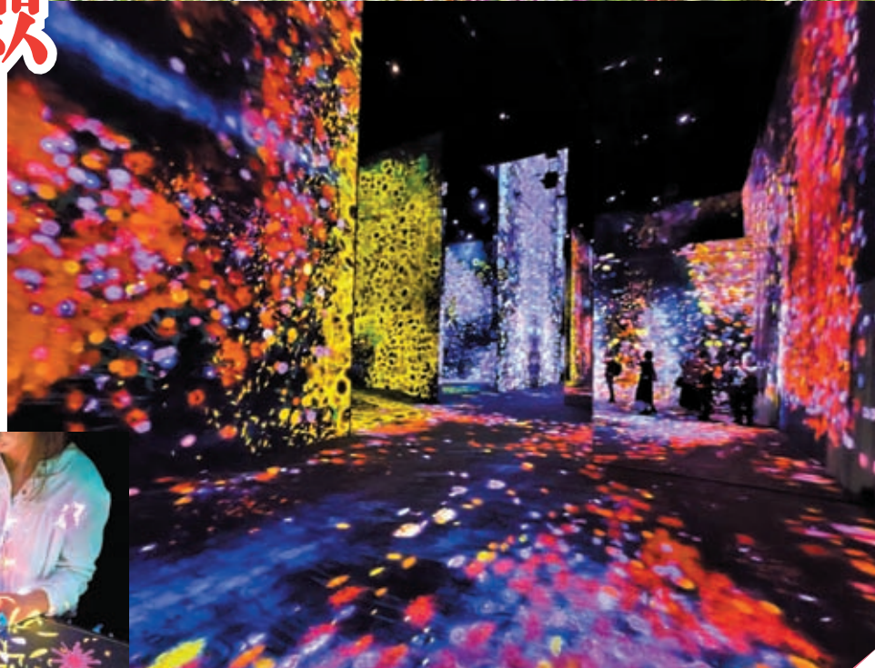
◆當進入 teamLab，已被色彩繽紛的藝術作品包圍。