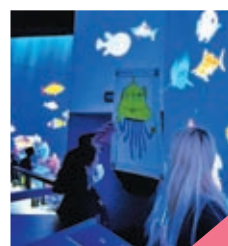
◆小朋友完成畫作掃描上載後，畫中小動物會出現在螢幕牆上。