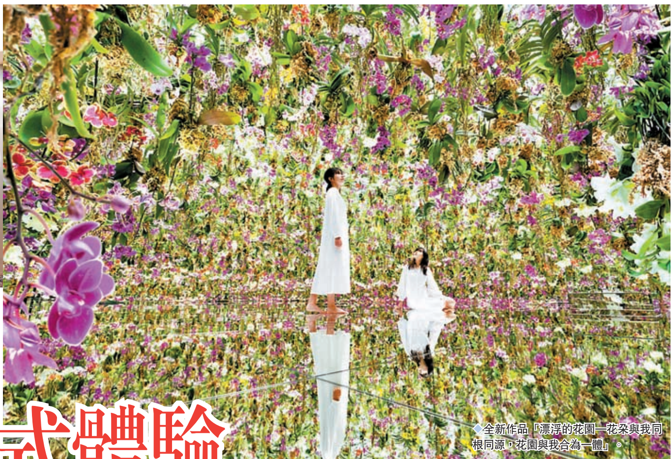
◆全新作品「漂浮的花園—花朵與我同根同源，花園與我合為一體」。