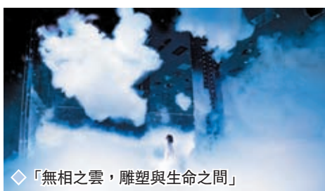
◆「無相之雲，雕塑與生命之間」