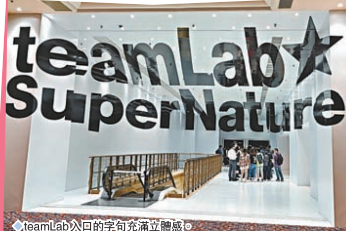
◆teamLab入口的字句充滿立體感。