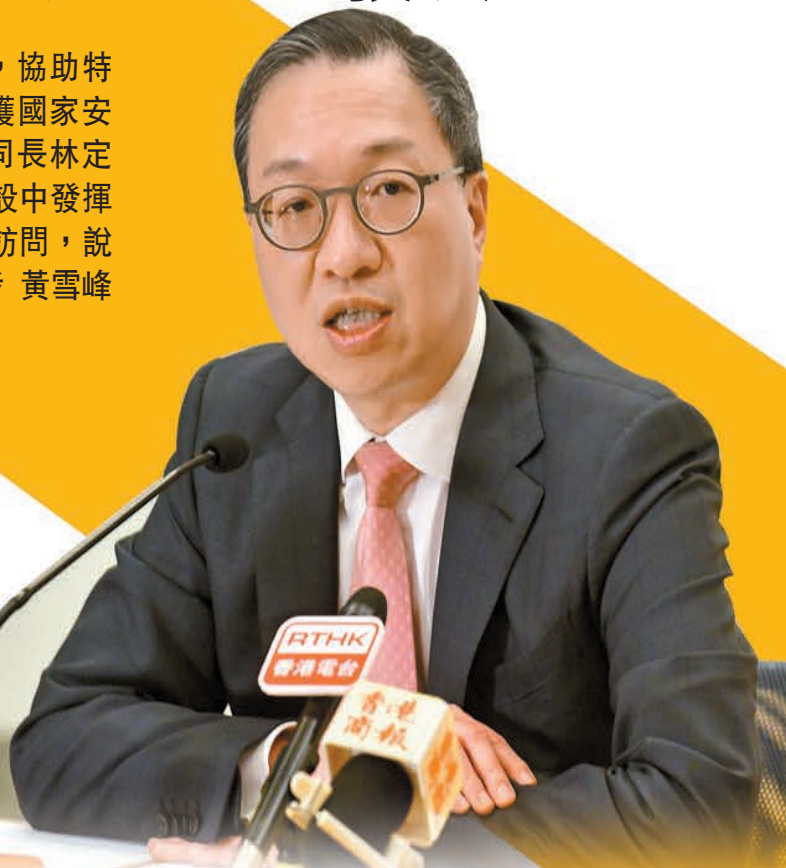
律政司司長林定國接受香港商報等媒體訪問，總結過去一年來工作。

被問到任內最難忘的經歷，林定國自是「一個善忘的人」，因要時刻面對新挑戰，遇到的困難和挫折都是一種經驗，他在檢討過後就會著眼於將來。