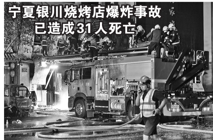
宁夏银川烧烤店爆炸事故已造成31人死亡。记者于宁夏回族自治区党委获悉,6月21日20时40分许,宁夏回族自治区银川市兴庆区民族南街富洋烧烤店操作间液化石油气(液化气罐)泄漏引发爆炸,造成38人受伤,其中31人经抢救无效死亡,7人正在全力救治中。

“巴拿马民众认识端午节是从龙舟比赛开始的。近年来,龙舟竞渡已经成为当地大热的文化活动,每年都会举办多次龙舟比赛,上千名选手积极参赛,为当地旅