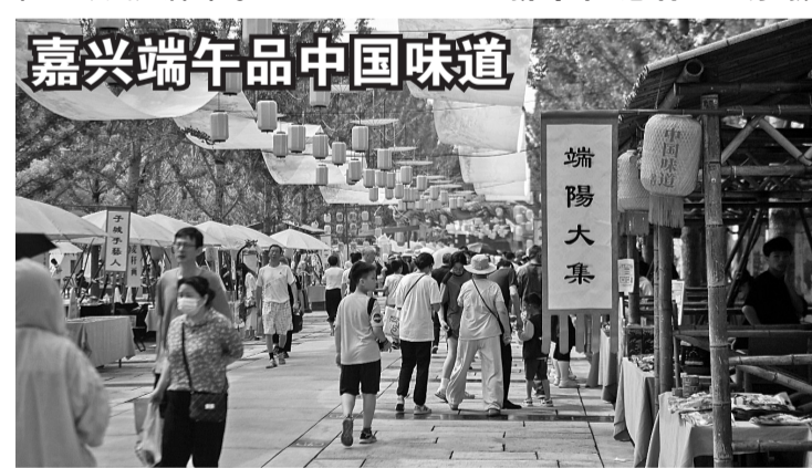
这是6月22日在嘉兴端午民俗文化节上拍摄的端阳大集。当日,2023嘉兴端午民俗文化节在浙江嘉兴子城遗址公园举行,本次端午民俗文化节日包括沉浸式体验宋韵文化的端阳大集、舞龙舞狮演出、龙舟大赛、非遗戏曲音乐展演等20多项文化活动,充分展现嘉兴悠久厚重的城市历史文化底蕴,营造浓厚的端午文化氛围,为市民和游客带来端午文化盛宴。