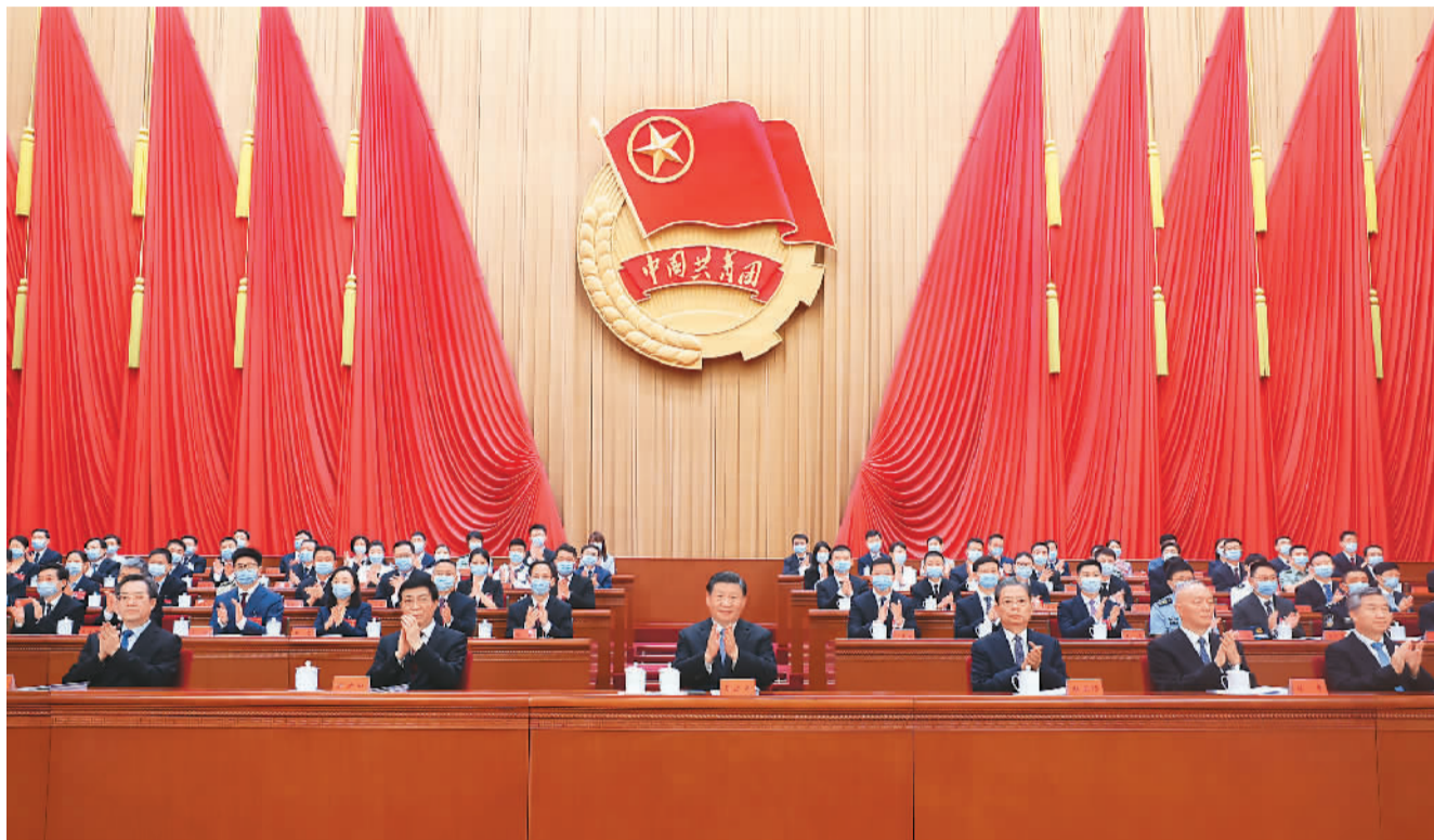
6月19日,中国共产主义青年团第十九次全国代表大会在北京人民大会堂开幕。习近平、赵乐际、王沪宁、蔡奇、丁薛祥、李希等在主席台就座,祝贺大会召开。

本报北京6月19日电 (记者李昌禹) 中国共产主义青年团第十九次全国代表大会19日上午在人民大会堂开幕。习近平、赵乐际、王沪宁、丁薛祥、李希等党和国家领导人到会祝贺,蔡奇代表党中央致词。 人民大会堂大礼堂灯光璀璨,气氛热烈。主席台上方悬挂着“中国共产主义青年团第十九次全国代表大会”会标,后幕正中是熠熠生辉的团徽,10面鲜艳的红旗分列两侧。二楼眺台悬挂标语:“以习近平新时代中国特色社会主义思想为指导,全面贯彻党的二十大精神,动员引领广大青年为全面建设社会主义现代化国家、全面推进中华民族伟大复兴团结奋斗!”近1500名来自全国各地的团十九大代表,肩负着7300多万共青团员的重托出席大会。 上午10时,中共中央总书记、国家主席、中央军委主席习近平等步入会场,全场响起