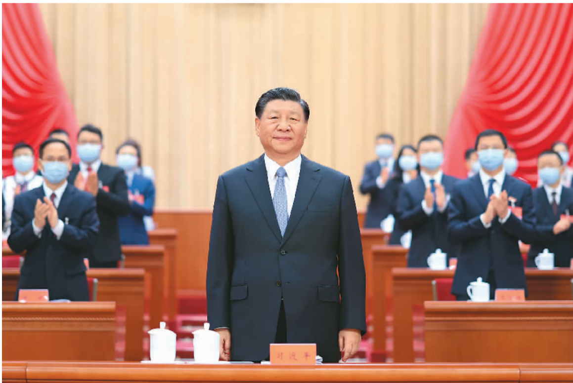
6月19日,中国共产主义青年团第十九次全国代表大会在北京人民大会堂开幕。这是中共中央总书记、国家主席、中央军委主席习近平在主席台向与会代表致意。