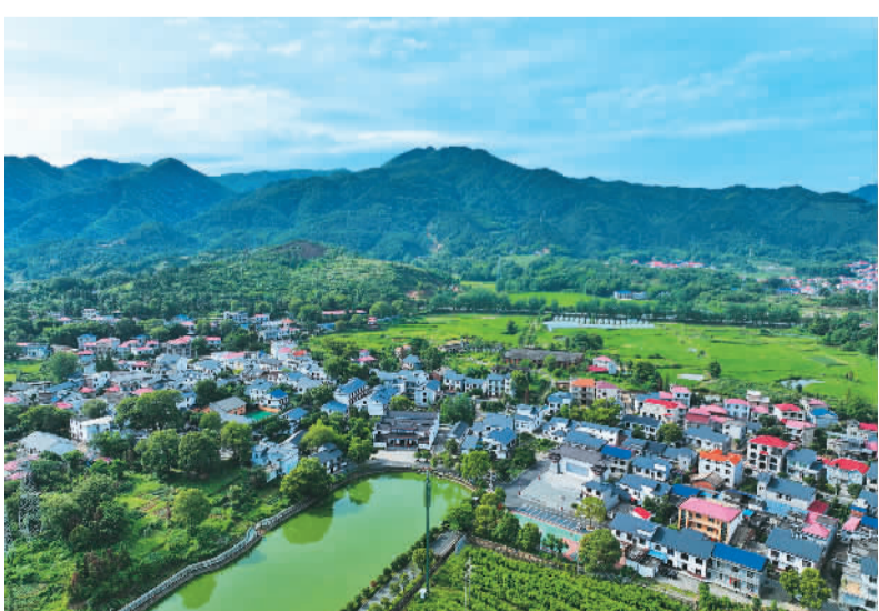
近年来,江西省萍乡市芦溪县践行“绿水青山就是金山银山”的发展理念,不断改善乡村面貌,着力打造山好、水好、空气好的绿色家园。图为该县芦溪镇东阳村秀美景色。