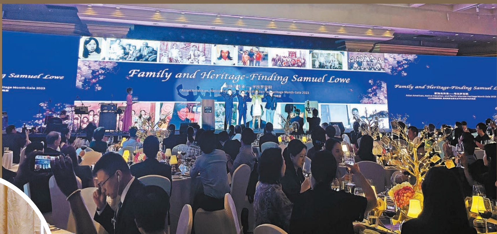
2023年亞太裔傳統月晚宴現場。