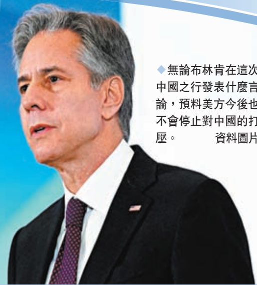
◆無論布林肯在這次中國之行發表什麼言論，預料美方今後也不會停止對中國的打壓。 資料圖片