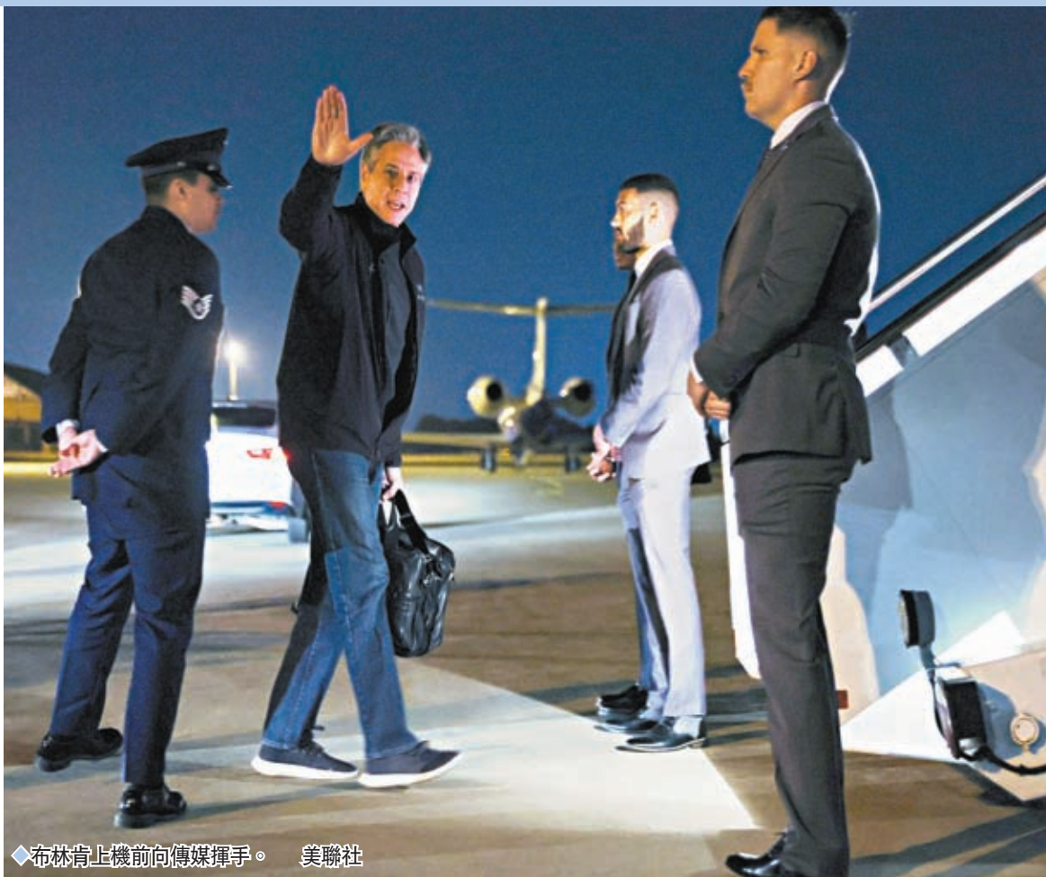
◆布林肯上機前向傳媒揮手。

中國國家主席習近平去年11月在印尼巴厘島與拜登會晤，當時習近平強調，台灣問題是中國核心利益中的核心，是中美關係第一條不可逾越的紅線；拜登則重申「四不一無意」，即「不尋求改變中國體制」、「不尋求『新冷戰』」、「不尋求通過強化盟友關係反對中國」、「不支持『台灣獨立』」，也不支持「兩個中國」「一中一台」，以及「無意同中國發生衝突」。