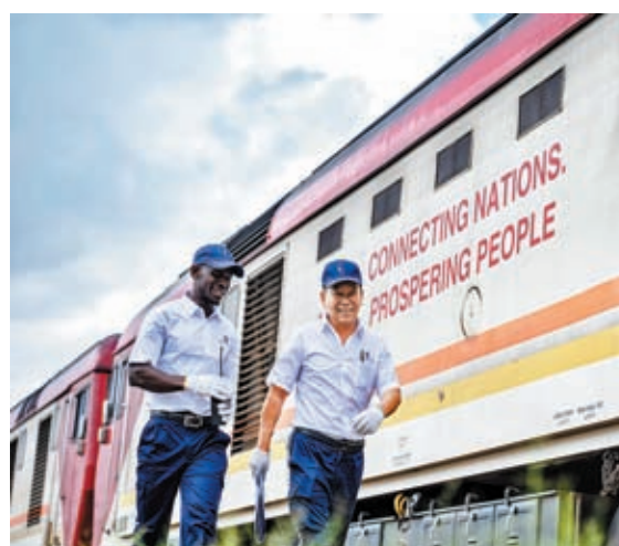
◆中國在非洲投入的基礎建設(圖)非常具吸引力，一眾發展中國家拒向美國靠邊站。

爭特別委員會」的調查和傳召權力更廣，幾乎涉及中美關係所有範疇，甚至包括美國退休基金在中國的投資。就在上月底，委員會通過兩份涉台及涉疆的所謂「政策建議報告」，當中提議「強化台灣防衛」等，並表示希望報告的一些建議可以在今年內「成為法律」。