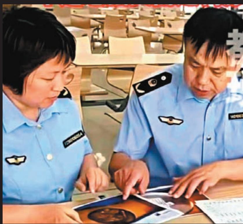
◆事發後，南昌市高新區市場監督管理局現場調查事件。 視頻截圖

此外，2021年11月，江西工職院被曝青山湖校區食堂清潔間內出現老鼠，涉事經營方為南昌市菁禾餐飲管理有限公司。此次事件發生後，有網友將矛頭劍指菁禾餐飲。6月7日上午，菁禾餐飲發布聲明稱，此事與公司無關，並指此次事件發生地為學院的瑤湖校區，「該校區餐飲公司是中快餐廳。」