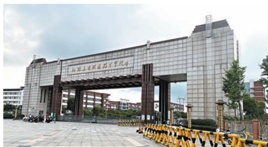
◆涉事的江西工業職業技術學院正門。