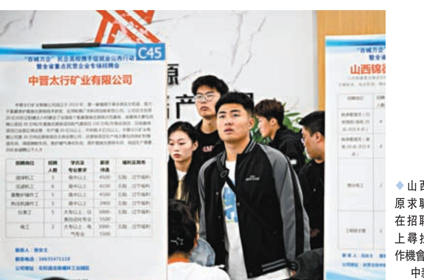
◆山西太原求職者在招聘會上尋找工作機會。

同時，針對青年的政策，既要促進青年當前的就業，也要關注失業對青年的長期負面影響，應該在政策設計上因勢利導地發揮青年的主動性以減少失業的長期負面影響。解決青年失業問題，政府、教育機構、企業和青年自己都責無旁貸。