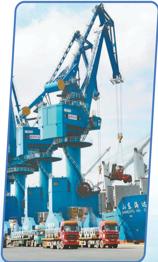
河北港口集團曹妃甸港區，起重機在進行作業。

廊坊大力發展臨空經濟和新一代信息技術、高端裝備製造、生物醫藥健康、現代商貿物流、都市現代農業等主導產業，培育壯大航空航運零部件、電子信息、影視文創等縣域特色產業，先後引進華為、京東、華大基因等一大批高端龍頭企業，產業鏈、創新鏈、供應鏈、價值鏈加快向高端躍升。特別是，隨著協同發展重大國家戰略向縱深拓展，基礎設施密度和網絡化程度全面提升，創新要素加快集聚，以現代商貿物流為代表的新的主導產業正在快速發展。廊坊明確把發展現代商貿物流產業作為全市「一號工程」，「三通一達」北方總部基地等一批戰略性引領項目相繼落戶，推動商貿物流產業迅猛發展，為廊坊實現跨越發展注入新的動力。