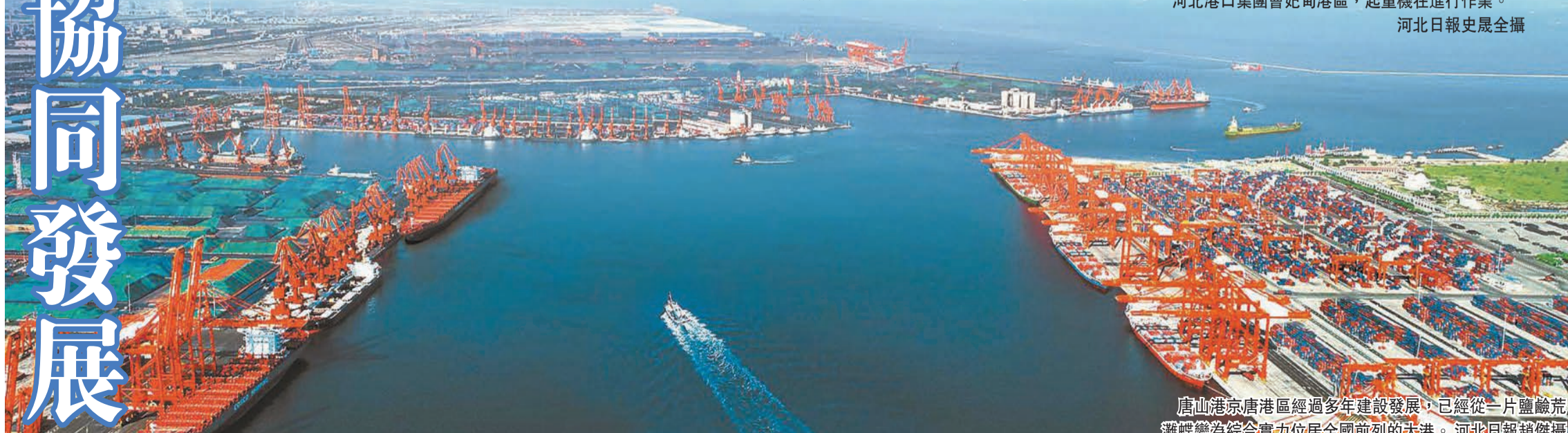
唐山港京唐港區經過多年建設發展，已經從一片鹽鹼荒灘蝶變為綜合實力居全國前列的大港。