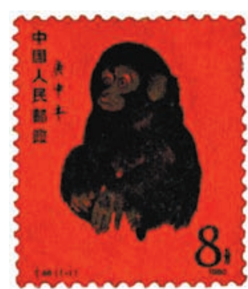
◆黃永玉設計的生肖郵票開山之作——庚申年猴。資料圖片