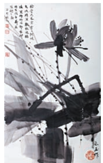
◆黃永玉水墨畫作品《墨荷》。