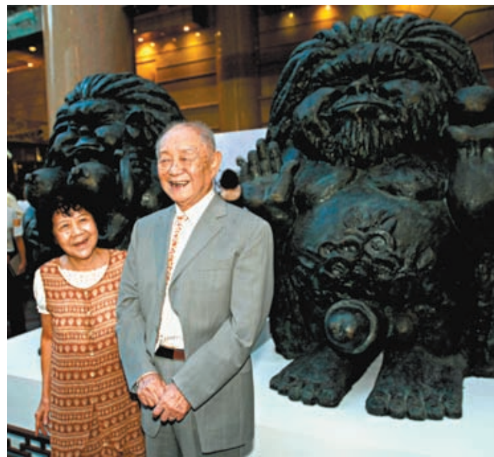
◆黃永玉和夫人張梅溪生前照片。

香港特區政府文化體育及旅遊局局長楊潤雄對黃永玉逝世深感痛惜，並向其家人致以慰問。「黃永玉的離去教我們惋惜，但他的作品將流傳後世，我們永遠懷念他。」楊潤雄讚揚黃永玉在畫壇享負盛名，屢獲殊榮，作品獨具風格，既有濃厚中國畫氣韻又具西方繪畫元素，畫風敢進不少後進。黃永玉亦是出色的版畫家和詩人，詩風質樸動人，發人深省。香港藝術館曾於2004年為他舉辦八十歲回顧展，亦藏有八件他的水墨作品和版畫。