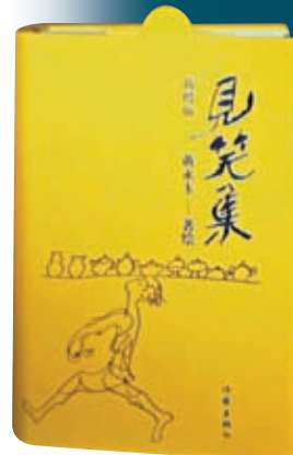
◆在99歲高齡時，黃永玉又出版新作《見笑集》。網上圖片