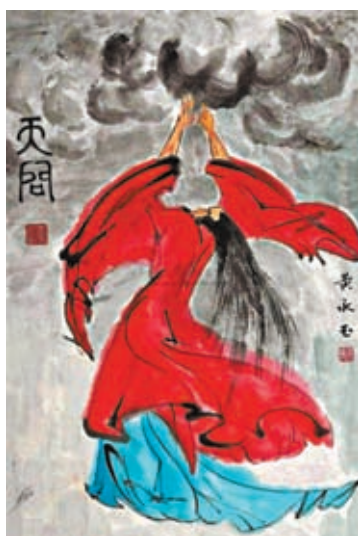
◆黃永玉水墨畫作品《天問》。