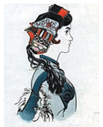
◆黃永玉木刻作品《阿詩瑪》。網上圖片