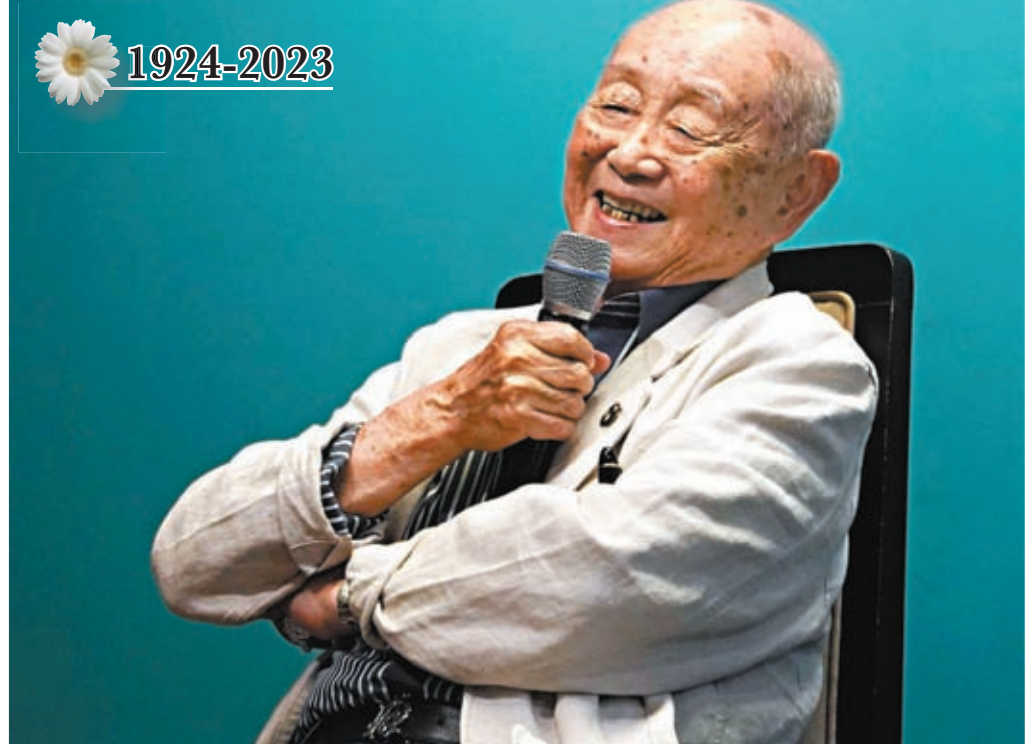
◆黃永玉於6月13日3時43分逝世，享年99歲。