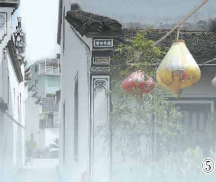
图1: 游客乘船在浙江省桐乡市濮院镇的濮院时尚古镇游览。 图2: 人们在浙江省绍兴市上虞区驿亭镇白马湖畔的茶社喝茶。 图3: 浙江省湖州市织里镇伍浦村渔村文化园的陶湾里乡村咖啡店。 图4: 浙江省安吉县余村的一处户外营地。 图5: 浙江省义乌市李祖村一景。 图6: 浙江省宁波市北仑区春晓街道双狮村俯瞰。