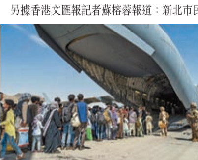
◆美媒稱華府已制定從台灣撤僑的計劃。圖為美軍在阿富汗的撤離行動。

敏感，美方未公開此舉，中方對此有何評論？汪文斌回應稱，「我不了解你提到的相關情況。但我知道的是美方嘴上說『挺台』，真正做的是把台灣當做棋子，把台灣民眾當作炮灰，為服務美國『以台制華』戰略，美方甚至制定『摧毀台灣計劃』，相信廣大台灣民眾會認清美『害台』、『毀台』的本質。」