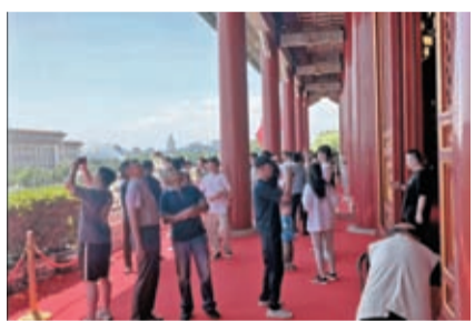
13日，天安門城樓恢復對外開放，首批遊客登陸城樓參觀。香港文匯報北京傳真

嫦娥八號將於2028年前後發射，由着陸器、飛躍器、月球車和月面操作機器人等組成，與嫦娥七號任務探測器和鵲橋二號中繼星協同工作，構建月球科研站基本型。初步具備開展月球資源開發利用能力。2030年前後，將建成月球科研站基本型。此後，在完善階段還將實施多次任務。比如，部署月面長期能源供給模塊和多種形式機器人，攜帶樣品返回地面，建立月基觀測設施等。月球科研站將開展五大科學主題研究：月