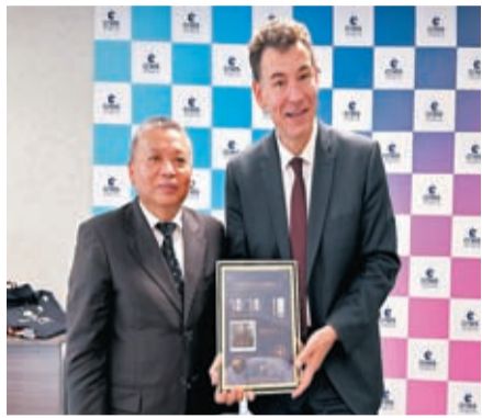
張克儉在巴黎會見歐洲空間局局長阿蘇巴赫。