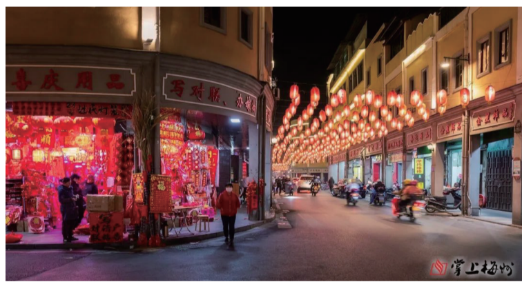
茶陽老街。