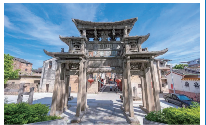
梅江區中山路。

本報訊(記者劉曉娟)6月8日，省政府門戶網站公布了《廣東省人民政府關於公布第四批廣東省歷史文化街區名單的通知》(以下簡稱《通知》)，梅州市、江門市、陽江市、清遠市四地共6處街區入選第四批廣東省歷史文化街區名單。其中，梅州3處歷史文化街區入選，分別是大埔縣百侯鎮侯