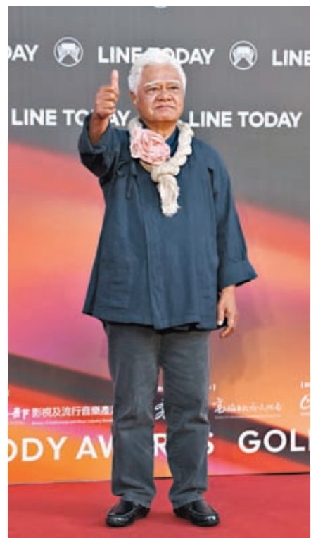
◆胡德夫登第33屆金曲獎紅毯。

胡德夫是華語流行音樂史上重要的存在。上世紀七十年代，胡德夫與李雙澤、楊弦等人在台灣發起「民歌運動」，他們大量創作歌曲並進行傳播。此後，華語樂壇的進一步發展，大批優秀唱片和原創歌手的出現，也要歸功於他們當年的振臂一呼。如今，胡德夫依然在唱歌。哪怕年紀已過古稀，他還是隨時準備着出發，去更多的地方，聽聽當地人的聲音。正如他自己說的那樣，他會一直