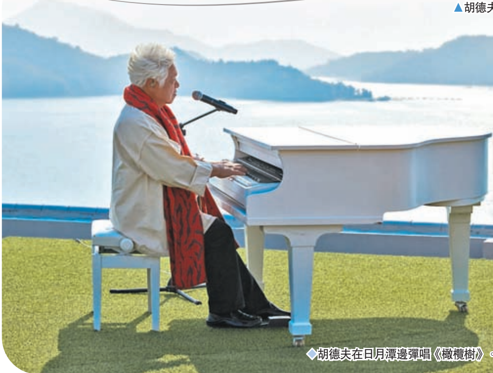
◆胡德夫在日月潭邊彈唱《橄欖樹》。