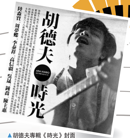
▲胡德夫專輯《時光》封面